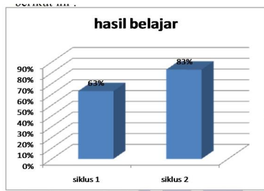
Gambar 3. Diagram hasil belajar siswa pada siklus I dan II

Tes hasil belajar diberikan setelah penyelesaian materi pada siklus 1 maupun siklus II. Data hasil belajar siswa disajikan dalam diagram berikut ini: