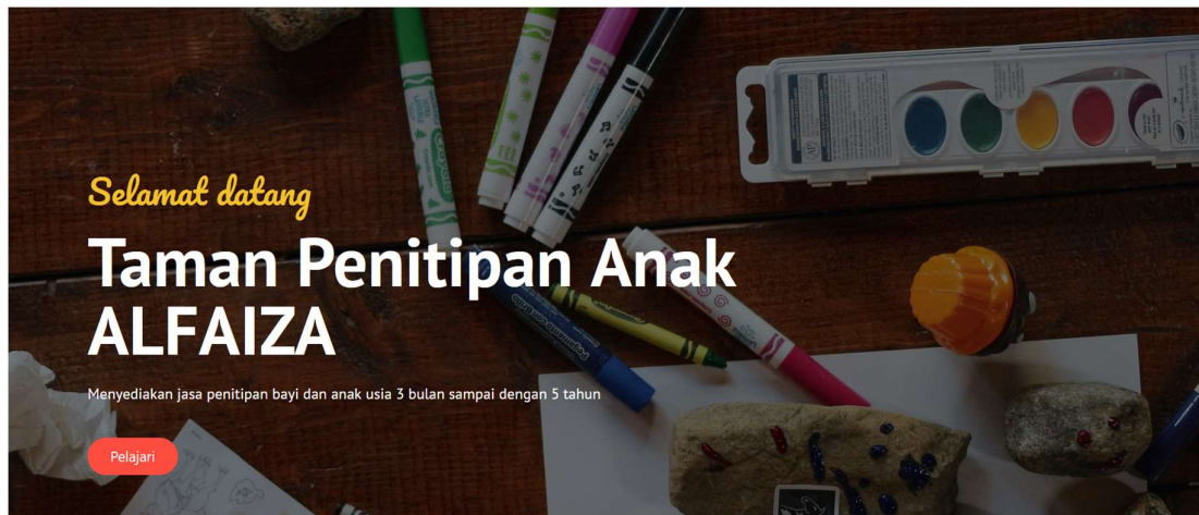
Gambar 2. Hero

Gambar di atas adalah section paling atas dari website , setiap halaman yang ada pada website memiliki section ini di bagian paling atas halaman. Bagian berwarna kuning adalah topbar , topbar berisi info lokasi sekolah, email, dan nama program unggulan. Kemudian di sisi kanan topbar , terdapat daftar sosial media milik sekolah.