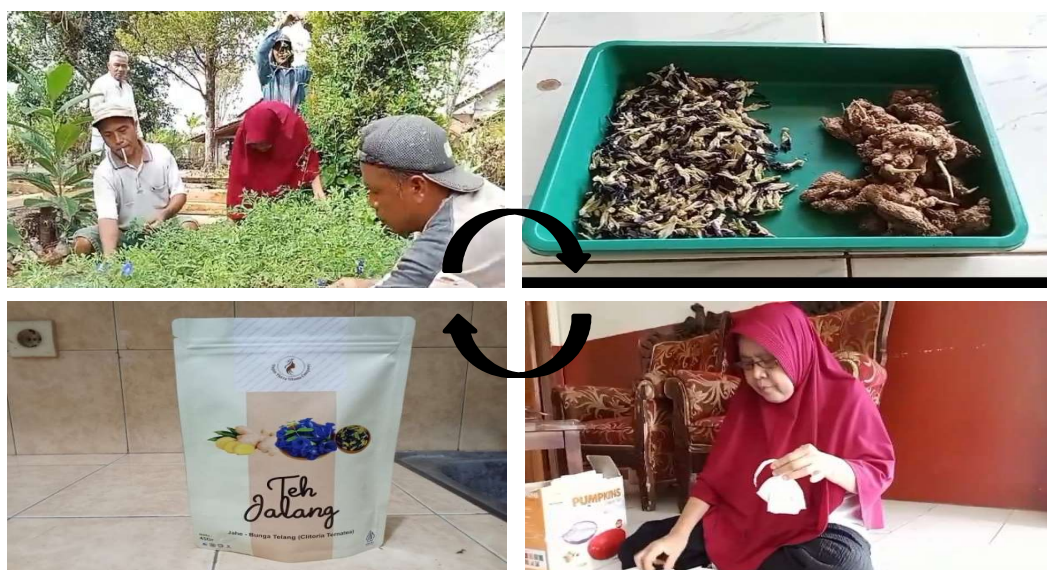
Gambar 2. Pembuatan Teh Jalang

Teh jalang merupakan teh berbahan dasar campuran jahe merah ( Zingiber officinale Roscoe) dan bunga telang ( Clitoria ternaea ). Bahan-bahan yang dibutuhkan dalam pembuatan teh Jalang adalah 1 kg Jahe merah dan \frac{1}{4} kg bunga telang. Proses pembuatan teh jalang terdiri atas beberapa langkah, diawali dengan penyiapan bahan-bahan dengan kondisi kering yang kemudian ditimbang. Langkah selanjutnya adalah pencampuran bahan-bahan tadi hingga merata, setelah itu dilakukan pengemasan ke dalam kantung teh ( cup ) dengan berat 2 gram per kantung. Langkah terakhir yang dilakukan adalah pengemasan kantung-kantung teh tadi ke dalam kemasan utama berupa poch yang sudah didesain menarik dengan jumlah yang dihasilkan sebanyak 20 poch . Pembuatan teh jalang disajikan pada gambar 2.