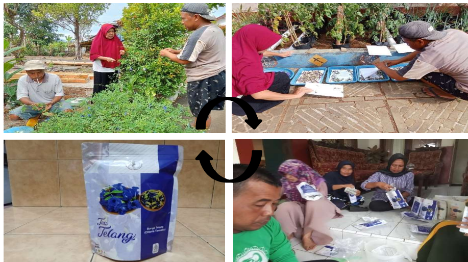
Gambar 1. Pembuatan Teh Telang ( Clitoria ternaea )

Teh telang merupakan minuman teh yang berasal dari bunga telang ( Clitoria ternaea ). Bahan yang dibutuhkan dalam pembuatan teh telang adalah bunga telang yang telah dikeringkan. Proses pembuatan teh telang cukup sederhana, bunga telang yang telah kering kemudian di masukan ke kantung teh dengan berat 2 gram per kantung. Setelah itu kantung-kantung teh tersebut kemudian dikemas dengan poch . pembuatan teh telang disajikan pada gambar 1.