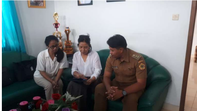
Gambar 1. Wawancara bersama Kepala Desa Lebih

dengan melakukan pengumpulan data melalui wawancara dengan perangkat Desa Lebih, yaitu dengan Kepala Desa Lebih dan Sekretaris Desa Lebih.