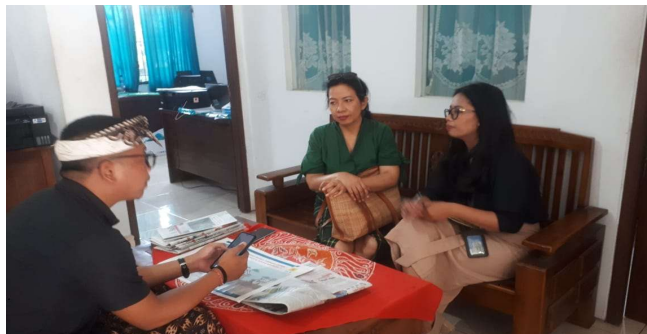
Gambar 2. Wawancara bersama Sekretaris Desa Lebih

Pendampingan penyusunan SOP Pelayanan Administrasi di Desa Lebih, Kecamatan Gianyar Kabupaten Gianyar dilaksanakan 4 bulan untuk tahap awal penyusunan, tahap pembahasan dan tahap akhir penyusunan SOP. Perangkat Desa Lebih telah memahami proses dari penyusunan SOP, SOP yang disusun oleh Perangkat Desa Lebih tidak hanya di buat dalam bentuk hard copy tetapi juga dibuat dalam bentuk soft copy berupa video alur pelayanan administrasi di Desa Lebih. SOP yang dibuat dalam bentuk hard copy diletakan di kantor Desa Lebih pada bagian pelayanan untuk memudahkan masyarakat untuk mengurus segala jenis urusan administrasi di Kantor Desa Lebih. Sedangkan untuk SOP yang dibuat dalam bentuk soft copy akan diupload pada website pemerintah Desa Lebih ( https://lebih.desa.id/ ) untuk memudahkan masyarakat memperoleh informasi mengenai alur pelayanan secara online. Adapun SOP Pelayanan Administrasi Desa Lebih ditunjukkan pada gambar di bawah ini: