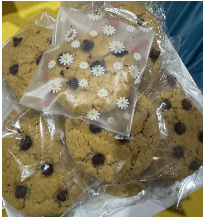
Gambar 2. Produk hasil kegiatan PkM

masalah ini, anggota kelompok penyandang disabilitas dapat memperbaiki kemasan produk dan memperluas jaringan pemasaran lebih lanjut. Selain pemasaran secara langsung, juga bisa dilakukan secara tidak langsung. Kegiatan PkM ini akan membantu anggota kelompok penyandang disabilitas memahami fungsi dan kegunaan kemasan dalam meningkatkan harga jual dan minat konsumen dalam membeli produk, serta membantu para anggota kelompok dalam memahami berbagai cara memasarkan produk secara online. melalui Tik Tok, WhatsApp, Facebook, Instagram, dan lain-lain. Terkait pemasaran digital, materi yang diberikan hanya berupa pengenalan saja, dengan mempertimbangkan keberagaman kemampuan anggota kelompok penyandang disabilitas dalam menggunakan media sosial. PkM ini bertujuan untuk meningkatkan Iptek dan keterampilan anggota kelompok disabilitas dalam bidang desain kemasan dan pemasaran produk secara online. Berdasarkan hasil evaluasi, keterampilan seluruh anggota dalam bidang pengemasan produk meningkat, dan anggota yang sebelumnya tidak mampu membuat desain kemasan plastik, kini dapat membuat desain kemasan setelah mengikuti pelatihan ini. Salah satu produk hasil kegiatan PkM tersaji dalam Gambar 2.