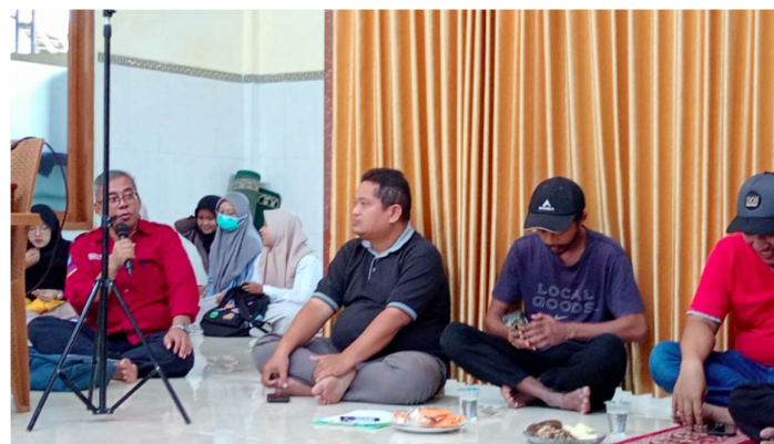
Gambar 3. Sosialisasi dan Penerapan Aplikasi Tabungan Qurban