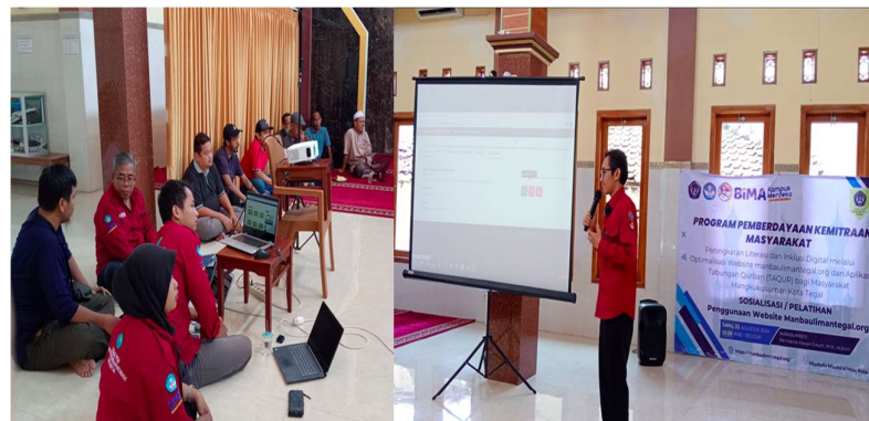
Gambar 2. Sosialisasi Pemanfaatan Website Musholla Manbaul Iman

Berikut beberapa dokumentasi saat proses pengabdian masyarakat mengenai Transformasi Digital dalam Pengelolaan Tabungan Qurban Melalui Optimalisasi Website manbaulimantegal.org di Mangkukusuman Kota Tegal: