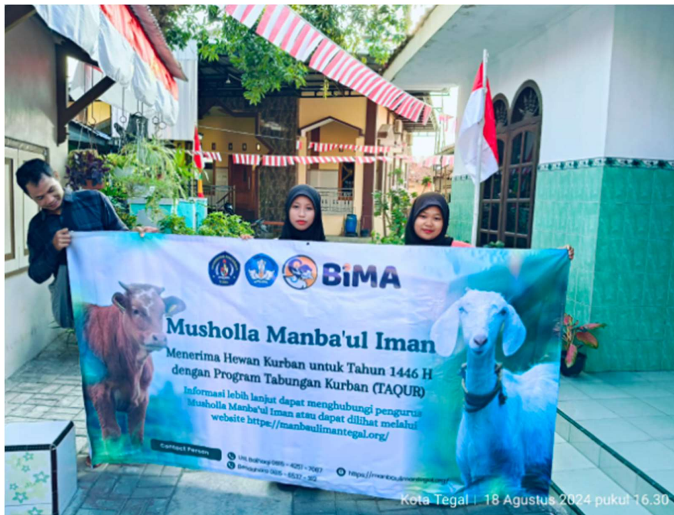
Gambar 8. Pemasangan Banner Informasi Penerimaan Qurban Melalui Tabungan Qurban

Setelah dilaksanakan kegiatan pengabdian masyarakat, beberapa hasil signifikan dapat diidentifikasi dalam proses transformasi digital pengelolaan Tabungan Qurban melalui optimalisasi website manbaulimantegal.org: