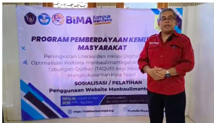
Gambar 6. Ketua Pengusul Pengabdian Masyarakat BIMA