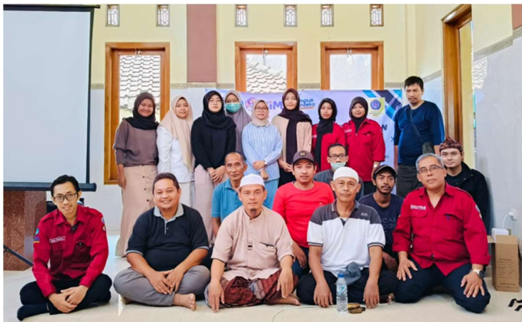
Gambar 5. Warga dan Pengurus Inti DKM Musholla Manbaul Iman