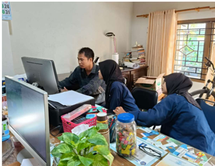
Gambar 4. Sosialisasi Administrator Pengelola Website