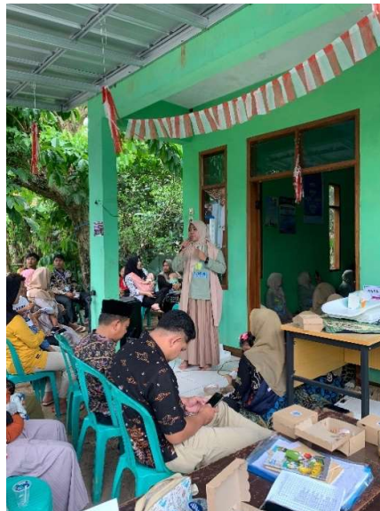
Gambar 2. Kegiatan Penyuluhan dengan Kalkulating