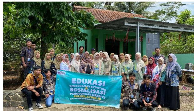
Gambar 3. Kegiatan Sosialisasi Kalkulating

Peningkatan pengetahuan pada kategori "baik" mencerminkan efektivitas Kalkulating dalam memberikan informasi yang mudah dipahami dan relevan dengan kebutuhan responden. Kalkulator ini memungkinkan orang tua untuk mengevaluasi status tumbuh kembang anak dengan data antropometri yang dikombinasikan dengan rekomendasi gizi berbasis bukti. Selain itu, intervensi ini juga mengurangi jumlah responden dalam kategori "kurang" dari 42,85% menjadi 0%. Hal tersebut penting karena rendahnya pengetahuan orang tua terkait pola pemberian makan sering kali menjadi faktor utama yang berkontribusi pada masalah stunting . Masih terdapat 19,04% responden dengan pengetahuan cukup setelah intervensi. Faktor-faktor seperti latar belakang pendidikan, akses informasi, dan pemahaman terhadap teknologi dapat memengaruhi hasil ini. Oleh karena itu, perlu dilakukan pendekatan yang lebih personal, seperti konsultasi individu atau pelatihan tambahan, untuk memastikan semua responden mencapai tingkat pengetahuan yang optimal.