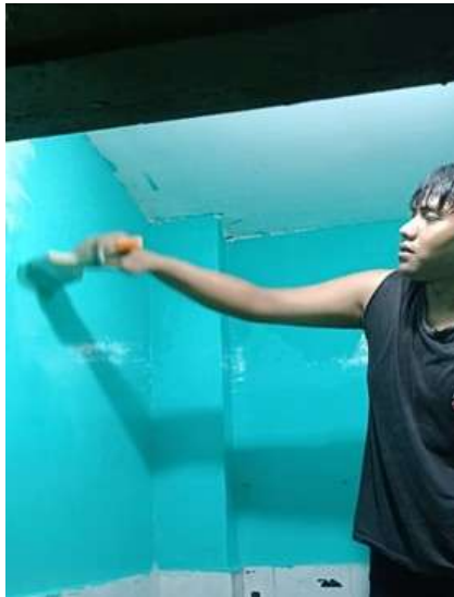
Gambar 5. Proses Pengecatan Dinding Kamar Mandi

Tahap selanjutnya adalah pengecatan dinding kamar mandi (Gambar 5). Setelah pengecatan selesai dilakukan, dinding terlihat lebih segar, bersih dan menarik. Selain itu, cat dinding memberikan perlindungan tambahan terhadap kerusakan dan kotoran. Terakhir, dilakukan finishing yaitu pengecatan pada sela-sela atau bagian-bagian kecil yang belum tercat, serta pembersihan pada area-area yang terlewatkan di tahap pengecatan sebelumnya (Gambar 6).