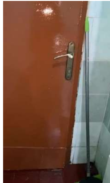
Gambar 10. Kusen Setelah Diperbaiki