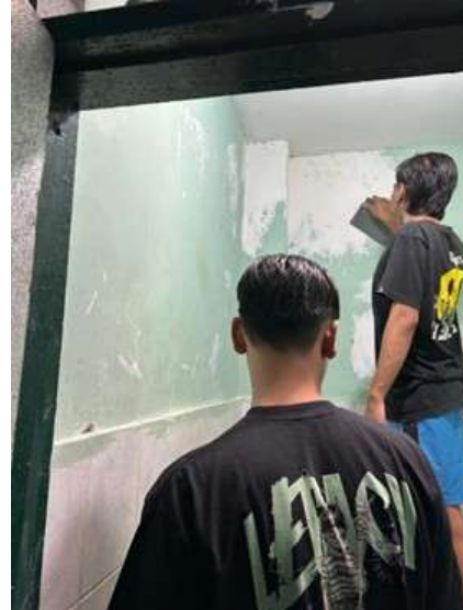
Gambar 4. Proses Pengamplasan Dinding Kamar Mandi

Tahap selanjutnya adalah pengecatan dinding kamar mandi (Gambar 5). Setelah pengecatan selesai dilakukan, dinding terlihat lebih segar, bersih dan menarik. Selain itu, cat dinding memberikan perlindungan tambahan terhadap kerusakan dan kotoran. Terakhir, dilakukan finishing yaitu pengecatan pada sela-sela atau bagian-bagian kecil yang belum tercat, serta pembersihan pada area-area yang terlewatkan di tahap pengecatan sebelumnya (Gambar 6).