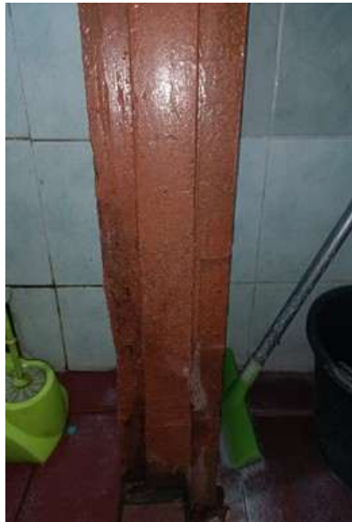
Gambar 9. Proses Setelah Pintu KM Diperbaiki

Setelah mengantar pintu ke tukang kayu dilakukan penambalan kusen dengan serbuk hasil perbaikan pintu. Setelah perbaikan kusen dan menunggu 2 hari setelah pengeleman, karena untuk pengeleman ini butuh waktu yang lama untuk kering dan siap untuk pintu Kembali dipasang. Terakhir dilakukan finishing yaitu pengecatan pada pintu yang sudah di renovasi, pengecatan dilakukan dikarenakan cat untuk kayu ini menghambat pengeroposan kayu. (Gambar 9 & Gambar 10).