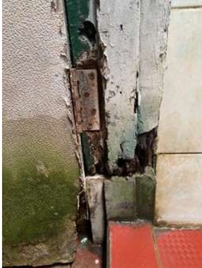
Gambar 7. Kusen yang Sudah Tidak Berbentuk