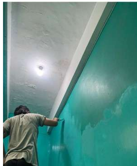
Gambar 6. Proses Pengecatan Tempat Wudhu

Setelah pengecatan dinding kamar mandi dan tempat wudhu tahap selanjutnya adalah perbaikan kusen kamar mandi yang mulai keropos dan perbaikan pintu yang sudah tidak layak (Gambar 7&8). Kusen yang sudah mulai keropos dan pintu bagian bawah yang sudah rusak harus segera dilakukan renovasi dengan tahap yang pertama menambal kusen dengan serbuk kayu di campurkan dengan lem rajawali. Untuk pintu kami antarkan ke tukang kayu untuk di perbaiki bagian yang sudah rusak.