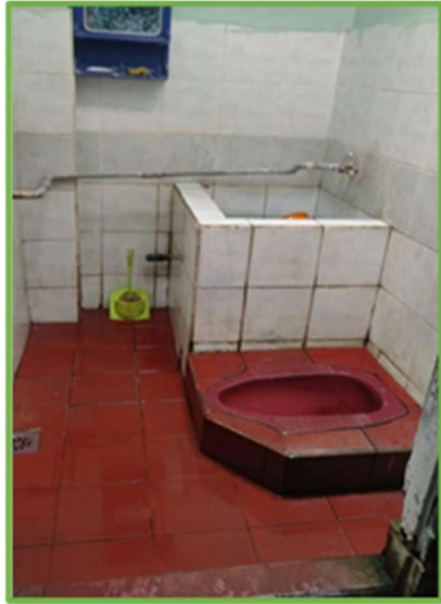
Gambar 3. Kondisi KM Awal