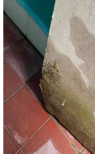
Gambar 8. Pintu yang Sudah Mulai Kropos

Setelah mengantar pintu ke tukang kayu dilakukan penambalan kusen dengan serbuk hasil perbaikan pintu. Setelah perbaikan kusen dan menunggu 2 hari setelah pengeleman, karena untuk pengeleman ini butuh waktu yang lama untuk kering dan siap untuk pintu Kembali dipasang. Terakhir dilakukan finishing yaitu pengecatan pada pintu yang sudah di renovasi, pengecatan dilakukan dikarenakan cat untuk kayu ini menghambat pengeroposan kayu. (Gambar 9 & Gambar 10).