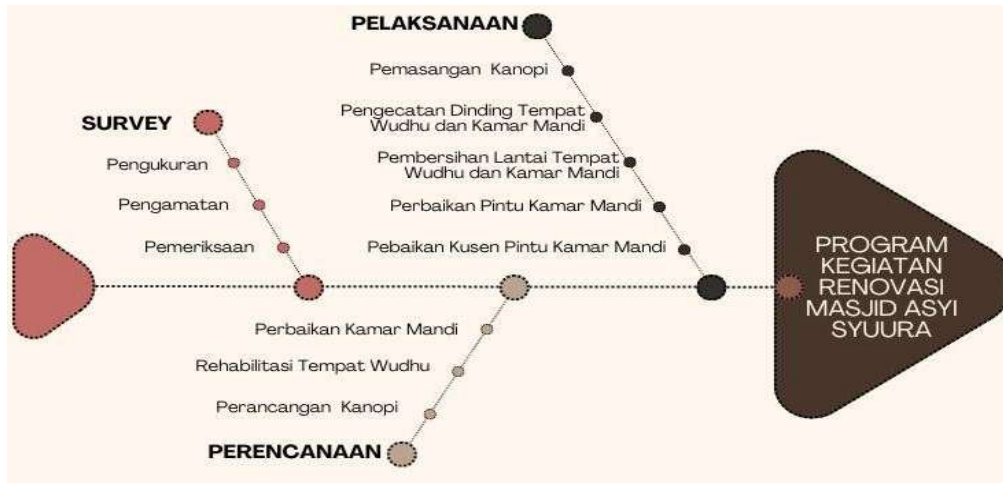
Gambar 1. Tahapan Pelaksanaan