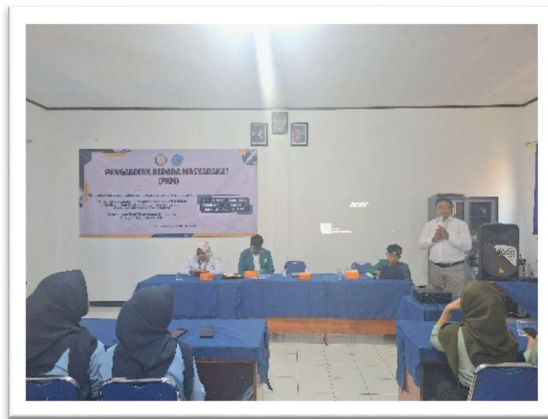
Gambar 1 Penyampaian Materi Kegiatan

Pada tahap awal, peserta diberikan pemahaman dasar mengenai LinkedIn, yaitu sebuah platform profesional yang dapat membantu membangun jaringan, mencari peluang kerja, dan memperkenalkan diri secara lebih profesional kepada dunia kerja. Dalam sesi ini, dijelaskan mengapa LinkedIn menjadi alat yang sangat penting, terutama bagi lulusan SMK yang sedang mempersiapkan diri untuk memasuki dunia kerja. Para pemateri menyampaikan bagaimana LinkedIn dapat meningkatkan peluang kerja dengan memberikan akses langsung ke berbagai perusahaan dan profesional dari berbagai bidang. Selain itu, dijelaskan juga bagaimana tren rekrutmen saat ini sudah banyak beralih ke platform digital seperti LinkedIn, di mana perekrut dapat melihat profil kandidat secara langsung sebelum memutuskan untuk rekrutmen ke tahap seleksi lebih lanjut (Lasut et al., 2024).