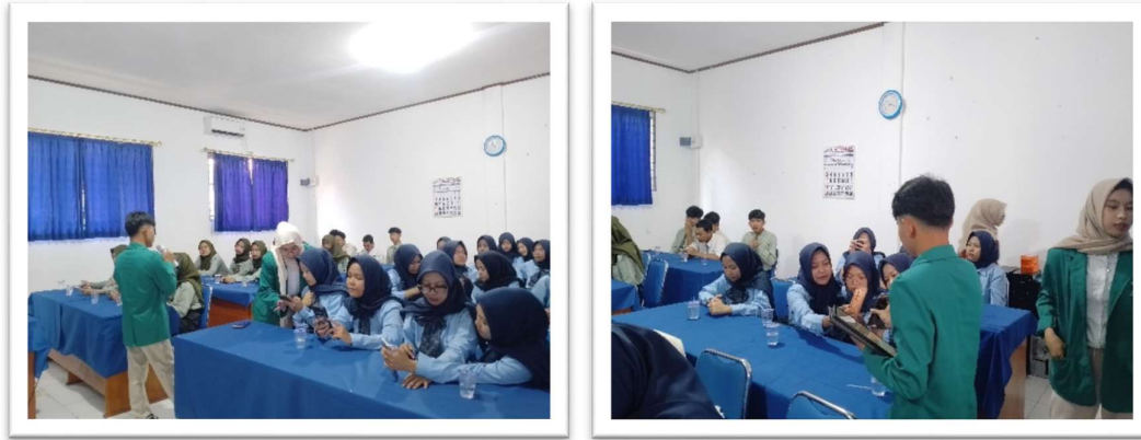
Gambar 2 Sesi Praktik Pembuatan LinkedIn