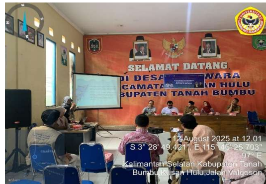
Gambar 2. Kegiatan Pemaparan Materi Albumin

Pemaparan materi mengenai potensi dan manfaat albumin dari ikan gabus ( Channa striata ) kepada masyarakat Desa Binawara dilakukan secara partisipatif. Melalui kegiatan ini, peserta mendapatkan pemahaman teoritis tentang kandungan gizi ikan gabus, teknik sederhana pengolahan albumin, serta peluang usaha yang dapat dikembangkan. Pemaparan materi berfungsi sebagai dasar pengetahuan sebelum praktik langsung dilakukan, sehingga masyarakat tidak hanya sekadar mencoba tetapi juga memahami aspek ilmiah dan manfaat kesehatan albumin. Materi yang diberikan juga menekankan pentingnya pengolahan higienis, pengendalian suhu saat ekstraksi, serta potensi albumin sebagai pangan fungsional bernilai jual.