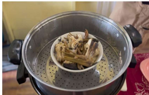
Gambar 3. Proses Pembuatan Albumin

Pemaparan materi mengenai potensi dan manfaat albumin dari ikan gabus ( Channa striata ) kepada masyarakat Desa Binawara dilakukan secara partisipatif. Melalui kegiatan ini, peserta mendapatkan pemahaman teoritis tentang kandungan gizi ikan gabus, teknik sederhana pengolahan albumin, serta peluang usaha yang dapat dikembangkan. Pemaparan materi berfungsi sebagai dasar pengetahuan sebelum praktik langsung dilakukan, sehingga masyarakat tidak hanya sekadar mencoba tetapi juga memahami aspek ilmiah dan manfaat kesehatan albumin. Materi yang diberikan juga menekankan pentingnya pengolahan higienis, pengendalian suhu saat ekstraksi, serta potensi albumin sebagai pangan fungsional bernilai jual.