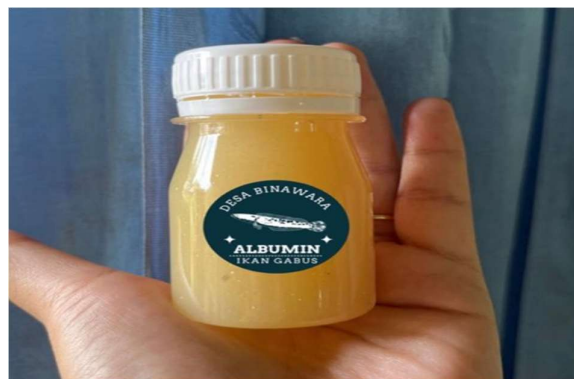
Gambar 4. Hasil Produk Pembuatan Albumin

Produk albumin cair jika disimpan pada tiga kondisi berbeda. Pada suhu ruang ( \pm 27^{\circ}\text{C} ), albumin hanya bertahan selama 1 hari, pada penyimpanan dingin ( 4^{\circ}\text{C} ) mampu bertahan hingga 3 hari, dan pada penyimpanan beku ( -18^{\circ}\text{C} ) dapat bertahan hingga 1 bulan tanpa mengalami perubahan signifikan pada organoleptik maupun kualitas gizi. Hasil ini sejalan dengan penelitian Chasanah et al. (2015) yang menyatakan bahwa penyimpanan beku lebih efektif mempertahankan kandungan albumin dibandingkan penyimpanan pada suhu ruang.