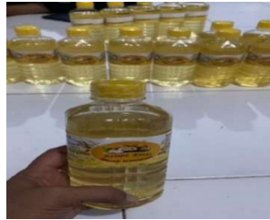
Gambar 4. Produk Kelapa Kemasan

Pelatihan manajemen usaha yang diberikan meliputi penentuan harga pokok penjualan, pemeliharaan peralatan, memastikan ketersediaan bahan baku, pembuatan laporan keuangan sederhana, serta media promosi dan pemasaran digital melalui media sosial dan e-commerce. Mitra didaftarkan melalui kanal pemasaran e-commerce dan diberikan pelatihan singkat tentang pengaturan toko dan transaksi penjualan. Tim pemberdayaan kemitraan masyarakat, dibantu oleh anggota kelompok UMKM dan mahasiswa, melakukan pengembangan dan pengujian sistem e-commerce . Gambar di bawah ini menunjukkan sistem e-commerce dan proses pengujiannya.