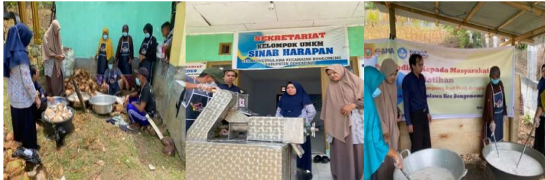
Gambar 2. Praktik Pembuatan Minyak Kelapa Murni

Proses pembuatan Minyak Kelapa Murni mudah diikuti oleh peserta, dipandu oleh tim pelaksana. Minyak Kelapa Murni yang dihasilkan jernih dan tidak berbau, yang menegaskan keberhasilan proses produksi Minyak Kelapa Murni ini.