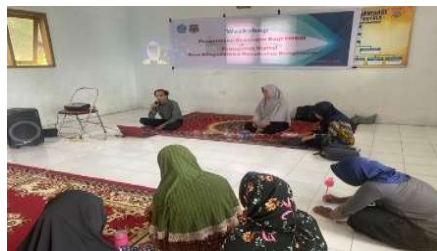
Gambar 1. Presentasi Materi dan Diskusi