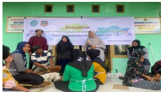
Gambar 3. Pelatihan Pembuatan Sapu

Proses pembuatan sapu menggunakan limbah sabut kelapa mengubah bahan yang tidak berharga menjadi bahan yang bernilai ekonomis tinggi. Pembuatan sapu ini cukup mudah dan hanya membutuhkan peralatan sederhana. Cukup rendam sabut kelapa selama kurang lebih 30 hari, lalu pisahkan dari kulit luarnya dan jemur hingga kering. Langkah terakhir adalah menjahitnya dengan gagang sapu.