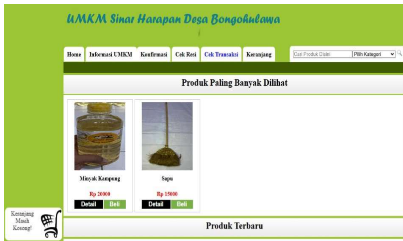
Gambar 5. Tampilan E-Commerce untuk Produk UMKM

Pelatihan manajemen usaha yang diberikan meliputi penentuan harga pokok penjualan, pemeliharaan peralatan, memastikan ketersediaan bahan baku, pembuatan laporan keuangan sederhana, serta media promosi dan pemasaran digital melalui media sosial dan e-commerce. Mitra didaftarkan melalui kanal pemasaran e-commerce dan diberikan pelatihan singkat tentang pengaturan toko dan transaksi penjualan. Tim pemberdayaan kemitraan masyarakat, dibantu oleh anggota kelompok UMKM dan mahasiswa, melakukan pengembangan dan pengujian sistem e-commerce . Gambar di bawah ini menunjukkan sistem e-commerce dan proses pengujiannya.