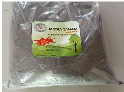
Gambar 1. Tahapan Pembuatan Media Tanam Organik Berbasis Eco Enzyme