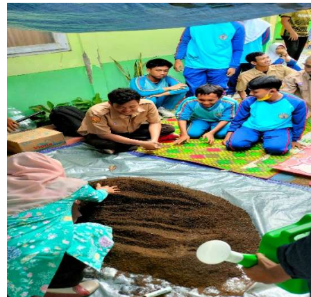
Tahap 4. Meratakan Campuran Media Tanam