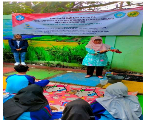
Tahap 2. Mengencerkan Eco Enzyme sebanyak 1 mL dalam 1 L air