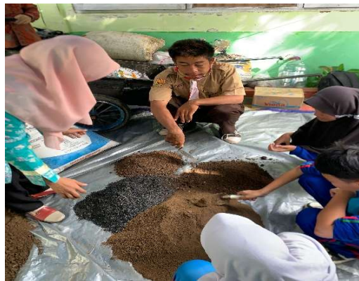
Tahap 1. Menyediakan Berbagai Media Tanam (Tanah, arang sekam, Kompos TPA, dan Pupuk Kandang Kambing)

Selama penjelasan materi tentang media tanam, peserta dari guru SLB Negeri 2 Indramayu bertanya tentang jumlah air yang digunakan untuk mencampur media tanam, lamanya waktu penyimpanan campuran media tanam. Ada pula siswa yang menanyakan tentang mengapa sekam harus di bakar? Situasi ini menunjukkan keaktifan dan keseriusan peserta ketika materi dijelaskan. Saat demonstrasi, semua bahan dan alat telah tersedia. Lalu dicontohkan terlebih dahulu. Kemudian peserta siswa praktik langsung dengan guru pendampingnya. Pembuatan media tanam organik berbasis eco enzyme , tersaji pada tahapan gambar dalam Gambar 1. Bentuk Produk Media Tanam hasil PkM berlabel dapat dijual dengan pemanfaatan untuk media tanam pembibitan sayuran dan media tanam penanaman sayuran, tersaji pada Gambar 2.