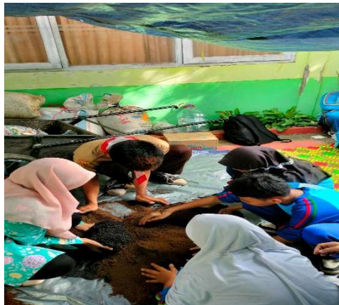
Tahap 3. Mencampur Rata Keempat Jenis Media Tanam