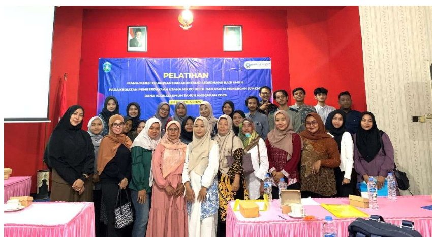
Gambar 4. Foto Bersama Pemateri dan Peserta

Digitalisasi akuntansi UMKM merupakan transformasi dari operasional manual menjadi sistem berbasis teknologi yang efisien, transparan, dan adaptif (Santoso et al., 2025). Model ini mendorong pemanfaatan platform digital untuk mengelola bisnis terutama pada bidang manajemen keuangan. Banyak pelaku UMKM memiliki pengetahuan atau literasi dan keterampilan keuangan yang terbatas sehingga berdampak pada pengembangan sebuah bisnis. Edukasi akuntansi digital merupakan sebuah upaya membantu UMKM membangun pengetahuan dan keterampilan keuangan pelaku UMKM (Ningsih et al., 2023). Aplikasi akuntansi berbasis android yang disampaikan dalam program ini memberikan kemudahan bagi pelaku UMKM karena dapat diakses kapan saja dan di mana saja menggunakan smartphone. Data keuangan yang tersaji secara sistematis melalui aplikasi digital memudahkan UMKM dalam melakukan analisis kinerja usaha, menyusun anggaran, serta membuat strategi pengembangan jangka panjang. Digitalisasi akuntansi tidak hanya menjadi alat pencatatan, tetapi juga instrumen dalam mendukung sustainability bisnis (Gunawan & Saputra, 2022). Hal ini sangat sesuai dengan karakteristik UMKM kuliner yang bersifat dinamis dan fleksibel (Rahmawati & Anisa, 2021).