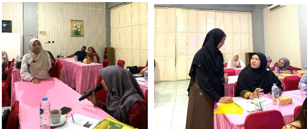
Gambar 3. Sesi Tanya Jawab