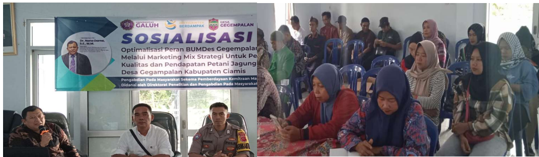
Gambar 1. Sosialisasi Progam PKM di Desa Gegempalan

“Pada musim hujan, jagung umumnya diusahakan pada lahan kering/tegalan, sedangkan pada musim kering pada sawah tadah hujan dan sawah irigasi”. Alasan utamanya di musim hujan jagung di tanam di tegalan adalah jagung dapat tumbuh subur dengan air hujan yang melimpah, sehingga tidak perlu sistem irigasi. Selain itu, menanam di lahan kering dapat menghindari genangan air yang bisa menyebabkan akar jagung membusuk. Sebaliknya, saat musim kemarau, jagung biasanya ditanam di sawah tadah hujan dan sawah irigasi. Hal ini karena lahan kering kekurangan air. Sawah tadah hujan dan sawah irigasi menyediakan sumber air yang dibutuhkan tanaman. Selain itu, praktik ini juga menjadi cara efektif untuk memanfaatkan lahan sawah yang kosong setelah panen padi, sehingga lahan tetap produktif sepanjang tahun. Saat ini, para petani menghadapi tantangan besar dalam menentukan pilihan musim tanam yang tepat. Perubahan iklim yang tidak menentu menyulitkan mereka memprediksi kondisi cuaca, sehingga sering kali panen bisa gagal. Untuk mengatasi masalah ini, Badan Usaha Milik Desa (BUMDes) perlu hadir sebagai lembaga yang bisa menaungi petani. Kehadiran BUMDes diharapkan dapat membantu petani agar tidak mengalami kerugian akibat ketidakpastian iklim. Kegiatan sosialisasi dapat dilihat pada gambar 1.