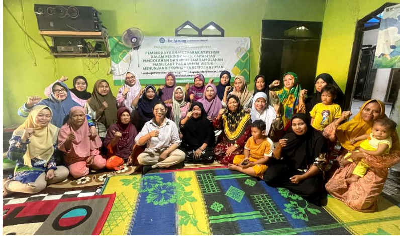
Gambar 7. Foto bersama dengan seluruh peserta kegiatan