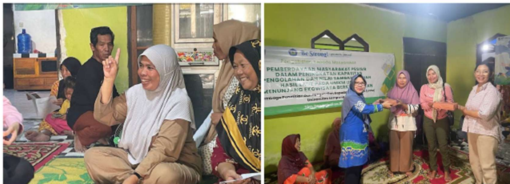
Gambar 6. Peserta aktif bertanya saat diskusi dengan narasumber dan pemberian hadiah bagi peserta teraktif

Partisipasi aktif peserta menjadi salah satu indikator keberhasilan kegiatan. Selama pelatihan berlangsung, peserta menunjukkan antusiasme tinggi melalui keaktifan bertanya, berdiskusi, dan berbagi pengalaman. Partisipasi dan keaktifan peserta dapat dilihat pada Gambar 7. Interaksi ini menciptakan suasana pembelajaran yang partisipatif dan memperkuat transfer pengetahuan antara narasumber dan peserta. Evaluasi pelaksanaan menunjukkan bahwa metode pelatihan berbasis praktik dan diskusi efektif dalam meningkatkan pemahaman, keterampilan, dan motivasi peserta untuk mengembangkan usaha pengolahan hasil laut secara mandiri dan berkelanjutan. Hal ini sejalan dengan pandangan Sukei et al (2021) bahwa pemberdayaan berbasis sumber daya lokal merupakan strategi penting untuk menciptakan pembangunan berkelanjutan di wilayah pesisir.