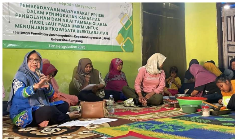
Gambar 3. Penyampaian materi sesi pertama

Materi pelatihan disampaikan dalam tiga sesi utama, yaitu gizi dan pangan, pengemasan dan labelling produk, serta praktik pengolahan hasil laut. Pada sesi pertama, narasumber menekankan pentingnya peningkatan nilai tambah ikan lokal melalui inovasi produk sate ikan ( punyew ), dapat dilihat pada Gambar 3. Pengolahan ikan menjadi sate ikan tidak hanya meningkatkan daya simpan dan nilai ekonomi, tetapi juga memberikan peluang usaha baru bagi pelaku UMKM. Hal ini sejalan dengan hasil penelitian Handayani & Rachman (2022) yang menegaskan bahwa diversifikasi produk olahan ikan mampu meningkatkan nilai tambah dan ketahanan ekonomi masyarakat pesisir. Selain itu, inovasi resep yang mempertahankan kandungan gizi dan menambahkan bahan bernilai nutrisi tinggi diharapkan dapat meningkatkan kualitas konsumsi ikan masyarakat setempat (Rizal et al. , 2022).