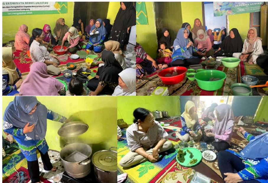
Gambar 5. Praktik pembuatan olahan ikan

Partisipasi aktif peserta menjadi salah satu indikator keberhasilan kegiatan. Selama pelatihan berlangsung, peserta menunjukkan antusiasme tinggi melalui keaktifan bertanya, berdiskusi, dan berbagi pengalaman. Partisipasi dan keaktifan peserta dapat dilihat pada Gambar 7. Interaksi ini menciptakan suasana pembelajaran yang partisipatif dan memperkuat transfer pengetahuan antara narasumber dan peserta. Evaluasi pelaksanaan menunjukkan bahwa metode pelatihan berbasis praktik dan diskusi efektif dalam meningkatkan pemahaman, keterampilan, dan motivasi peserta untuk mengembangkan usaha pengolahan hasil laut secara mandiri dan berkelanjutan. Hal ini sejalan dengan pandangan Sukei et al (2021) bahwa pemberdayaan berbasis sumber daya lokal merupakan strategi penting untuk menciptakan pembangunan berkelanjutan di wilayah pesisir.