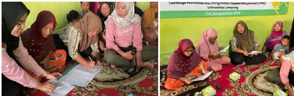
Gambar 2. Peserta sedang mengerjakan pre-test

Pelaksanaan kegiatan diawali dengan pre-test (Gambar 2), dilanjutkan penyampaian materi, diskusi interaktif, praktik pembuatan produk, dan diakhiri dengan post-test . Pre-test dan post-test digunakan untuk mengukur perubahan pengetahuan dan keterampilan peserta sebelum dan sesudah mengikuti pelatihan. Hasil evaluasi menunjukkan peningkatan pemahaman peserta terhadap materi gizi, pengolahan produk, dan strategi personal branding melalui kemasan dan label produk, yang menandakan efektivitas metode penyuluhan yang diterapkan. Hal ini sejalan dengan temuan Haryanti dan Wicaksono (2022) yang menyatakan bahwa peningkatan kapasitas kewirausahaan masyarakat dapat dicapai melalui pelatihan berbasis partisipatif dan praktik langsung.