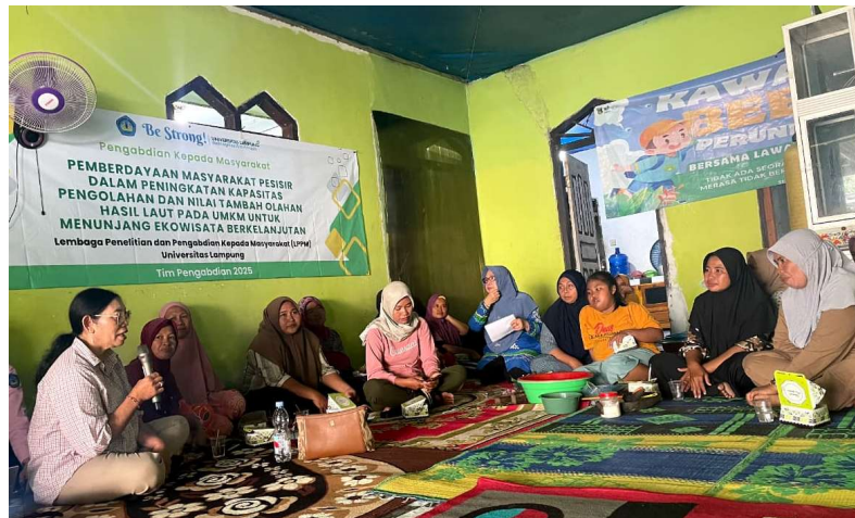
Gambar 4. Penyampaian materi sesi kedua

UMKM serta memperkuat keberlanjutan ekonomi desa (Kusuma & Hidayat, 2020; George et al. , 2021).