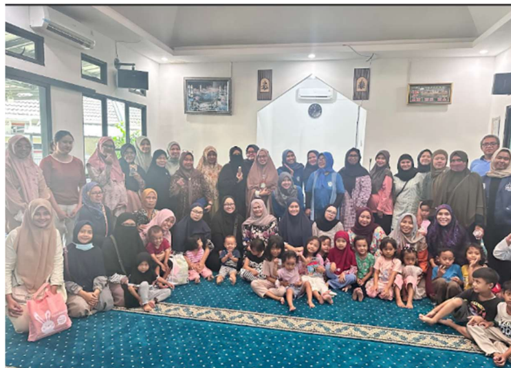
Gambar 7. Kegiatan PkM Membuat Sabun Eco-enzym

Gambar 7 merupakan foto kegiatan PkM yang memperlihatkan antusiasme warga dalam mengikuti penyuluhan dan pelatihan pembuatan sabun eco-enzym . Kegiatan pelatihan ini berhasil meningkatkan pemahaman dan keterampilan praktis warga dalam mengolah eco-enzyme menjadi sabun cair ramah lingkungan. Selain manfaat ekologis dalam mengurangi volume sampah organik, kegiatan ini juga membuka peluang ekonomi mikro melalui produksi sabun eco-enzyme yang dapat dijual atau digunakan secara mandiri di lingkungan perumahan. Hal ini sejalan dengan tujuan SDG 12 ( Responsible Consumption and Production ) dan prinsip ekonomi sirkular , yaitu mengubah limbah menjadi sumber daya yang bermanfaat.