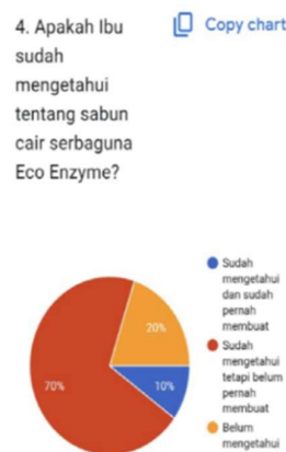
Gambar 4. Tingkat Pengetahuan Awal Peserta Mengenai Sabun Eco-enzym

Sebelum dilakukan pelatihan, peserta diminta mengisi kuisioner awal. Hasil kuisioner awal (Gambar 4) memperlihatkan bahwa sebagian besar peserta (70%) sudah mengetahui tetapi belum pernah mencoba membuat sabun cair serbaguna eco-enzyme , sementara 10% peserta sudah pernah membuatnya, dan 20% peserta belum mengetahui sabun cair eco-enzym . Temuan ini menunjukkan bahwa sebagian besar peserta belum pernah membuat sabun eco-enzym , sehingga kegiatan pelatihan ini menjadi sarana penting untuk meningkatkan kemampuan warga dalam pengelolaan sampah organik dan penerapannya dalam produk rumah tangga berupa sabun eco-enzym .