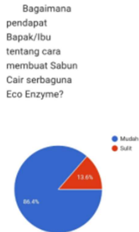
Gambar 6. Persepsi Tingkat Kesulitan Peserta dalam Membuat Sabun Eco-enzym

Hasil kuisisioner pada Gambar 6 menunjukkan bahwa 86,4% peserta menilai proses pembuatan sabun cair eco-enzyme mudah dilakukan , dan hanya 13,6% yang menganggapnya sulit. Hal ini membuktikan bahwa formula dan tahapan pembuatan sabun yang sederhana dan tidak memerlukan pemanasan sangat cocok diaplikasikan di tingkat rumah tangga. Kemudahan proses ini juga berpotensi meningkatkan keberlanjutan kegiatan, karena warga dapat melanjutkan praktik pembuatan sabun secara mandiri setelah kegiatan PkM berakhir.