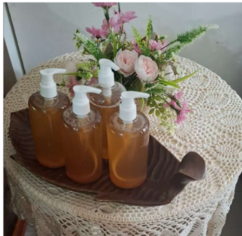
Gambar 3. Sabun Eco-enzyme Hasil Pelatihan

Hasil yang diperoleh dari kegiatan PkM ini adalah sabun eco-enzyme yang dapat dimanfaatkan langsung oleh peserta PkM (Gambar 3). Selain itu, untuk mengukur tingkat keberhasilan kegiatan PkM diukur melalui proses tanya jawab mengenai materi dan pengisian kuisioner kepuasan peserta.