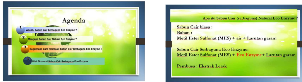
Gambar 2. Materi Penyuluhan Pembuatan Sabun Eco-enzym