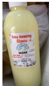
Gambar 2 Eling Siber dalam disain Logo untuk stiker kemasan susu kambing segar

Karya Eling Siber ini kemudian dijadikan label kemasan produk susu kambing yang dapat meningkatkan kualitas pemasaran susu kambing merek Segar. Dengan adanya Eling Siber di kemasan botol merek Segar ini akan memengaruhi keputusan konsumen untuk membeli. Terbukti hasil penjualan 1 bulan sebelum dan sesudah pemasangan Eling Siber Label Produk meningkat sebesar 10%. Dengan demikian, Eling Siber ini dapat menarik perhatian konsumen seperti terlihat dari hasil survey terhadap 19 orang konsumen (Gambar 3). Dari 19 responden menyatakan kebanyakan konsumen setuju (84%) bahwa Eling Siber "A happy drink, fresh from happy goats" dapat menarik perhatian konsumen.