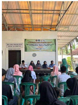
Gambar 1. Suasana pelatihan Eling Siber

Kegiatan pengabdian kepada masyarakat ini diselenggarakan dalam bentuk pelatihan kepada 10 orang anggota industry rumah tangga Putra Galuh Farm sebagai produsen susu kambing merek Segar . Pelatihan dilaksanakan selama satu hari, yaitu pada hari Rabu tanggal 23 Juli 2025 di area kandang Putra Galuh Farm. Penerapan Metode Project-Based Learning digunakan untuk mengembangkan keterampilan Eling Siber berbasis ekoliterasi untuk dijadikan logo, konten promosi neon box/ reklame/ banner, konten media sosial, dan konten pada kemasan. Kegiatan ini berujuan untuk meningkatkan keberdayaan mitra terhadap Eling Siber untuk peningkatan kualitas pemasaran susu kambing merek Segar .