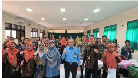
Gambar 6. Tim Pengabdian beserta Pengurus MGMP dan Peserta Pendampingan