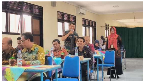
Gambar 5. Peserta Pendampingan Menyampaikan Hambatan Penyusunan Rancangan Pembelajaran