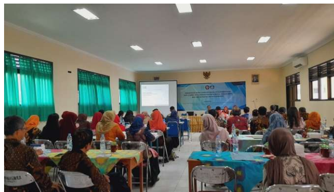
Gambar 3. Penyampaian Materi dari Narasumber dari Tim RG Dikdasmen UNS