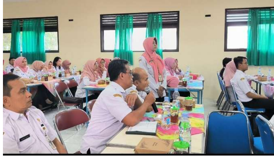
Gambar 4. Guru Peserta Pendampingan yang Aktif dalam Kegiatan Diskusi