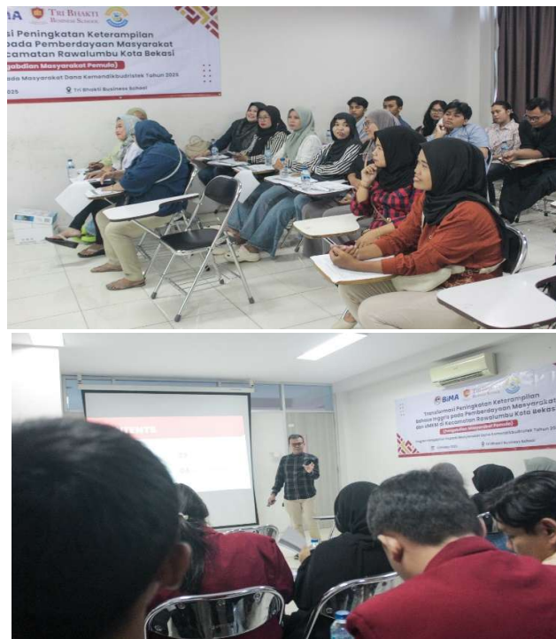
Gambar 1. Pelaksanaan Kegiatan

Metode ini terbukti efektif meningkatkan kompetensi bahasa Inggris praktis, literasi digital, dan kepercayaan diri peserta UMKM dalam menghadapi pasar global.