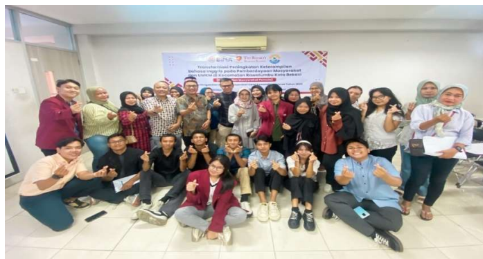
Gambar 3. Foto bersama peserta kegiatan