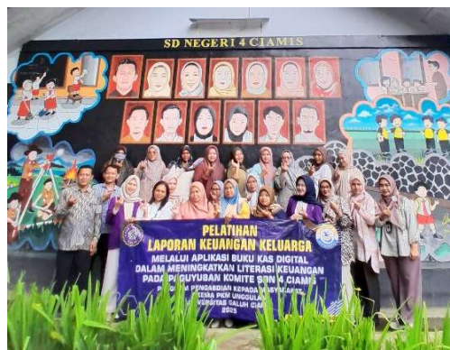
Gambar 6. Peserta Pelatihan Laporan Keuangan Keluarga melalui Aplikasi Buku Kas Digital dalam Meningkatkan Literasi Keuangan pada Paguyuban Komite SDN 4 Ciamis

Peningkatan kemampuan ini juga selaras dengan hasil penelitian (Agustin et al. 2024) tentang pelatihan literasi keuangan digital bagi atlet disabilitas, di mana peserta mampu memanfaatkan platform digital ( Shopee Affiliate ) untuk menambah pendapatan. Secara teoretis, hal ini membuktikan bahwa pelatihan berbasis teknologi mampu memperkuat inklusi digital dan mendorong masyarakat dari berbagai latar belakang sosial untuk lebih adaptif terhadap inovasi finansial.