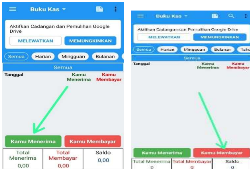
Gambar 3. Cara Pencatatan Transaksi Penerimaan dan Pengeluaran