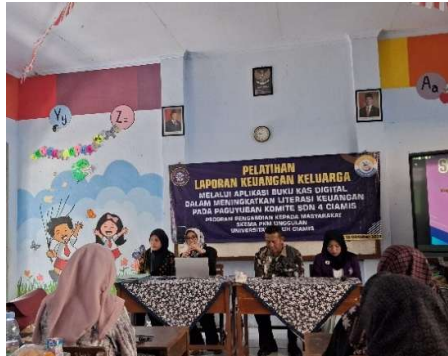
Gambar 5. Pembukaan Kegiatan oleh Kepala Sekolah SDN 4 Ciamis

Selain itu, hasil pelatihan ini memperkuat temuan pengabdian sebelumnya (Yuyun Susanti, Dedeh, Ilah, Rini Agustin Eka Yanti 2023) tentang pemberdayaan perempuan melalui penyuluhan literasi keuangan digital , yang menunjukkan peningkatan pemahaman dan kesadaran masyarakat terhadap pengelolaan keuangan digital serta keamanan data pribadi. Dengan pendekatan praktis dan bahasa yang mudah dipahami, pelatihan di SDN 4 Ciamis mampu menjangkau kelompok masyarakat dengan latar belakang pendidikan menengah yang heterogen.