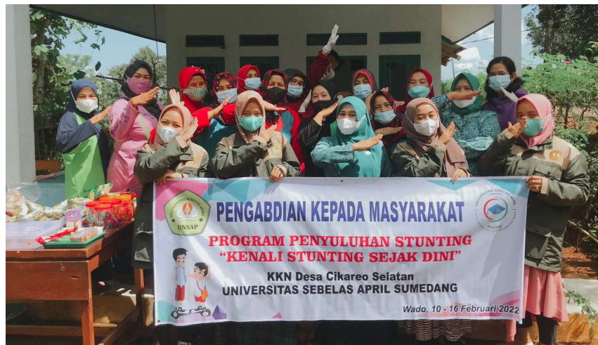
Gambar 2. Program Penyuluhan Stunting di Dusun Warung

Bahkan di sela-sela kegiatan hadir pihak kecamatan yang diwakili oleh ibu camat dan kader posyandu kecamatan yang selalu melakukan kunjungan rutin terhadap kegiatan posyandu yang ada di desa-desa di Kecamatan Wado. Hal ini menunjukkan bahwa pihak pemerintah sangat aktif dalam menyoroti tingkat penurunan stunting nasional.