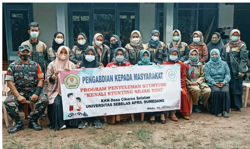
Gambar 2. Program Penyuluhan Stunting di Dusun Elos

Kegiatan dilakukan dengan pembagian pamflet baik secara langsung berupa selebaran maupun foto menggunakan grup whatsapp, pemaparan materi stunting kepada masyarakat dan tanya jawab terkait stunting sampai masyarakat benar-benar memahami mengenai stunting dan pencegahannya. Secara umum setelah dilakukan program penyuluhan stunting sebagian besar masyarakat di desa Cikareo Selatan sudah mengerti tentang apa itu stunting , penyebab stunting , ciri-ciri stunting , dan bagaimana cara pencegahan stunting .