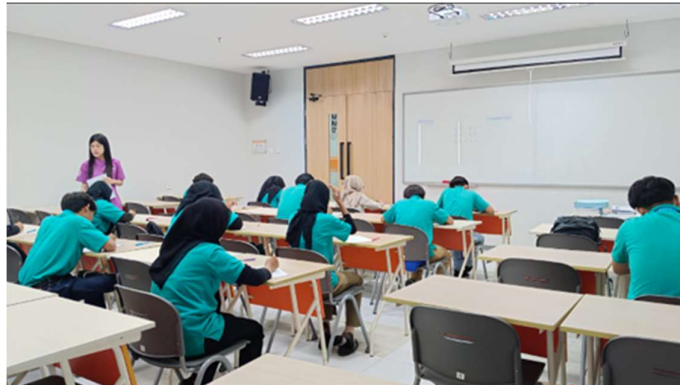
Gambar 5. Proses Pelaksanaan Psikotes

Setelah mendapatkan penjelasan mengenai psikotes, peserta dibawa ke ruangan khusus yang tersedia di Fakultas Psikologi Universitas Ciputra. Para peserta kemudian diberi kesempatan untuk mengerjakan psikotes secara langsung. Hal ini dilakukan agar peserta memperoleh pengalaman riil pengerjaan psikotes yang menjadi bekal bagi mereka jika nantinya perlu mengerjakan tes serupa saat mencari kerja. Selain itu, tes ini merupakan tes yang sebenarnya sehingga bisa diperoleh gambaran hasil psikotes mereka. Proses pelaksanaan psikotes dimulai dengan tahap registrasi dan pengarahan, di mana peserta mengisi data diri serta menerima penjelasan mengenai aturan dan jenis tes yang akan dikerjakan. Selanjutnya, peserta mengerjakan serangkaian tes tertulis, yang masing-masing memiliki batas waktu tertentu. Selama pelaksanaan, peserta mengikuti instruksi dengan tertib dan menjaga konsentrasi. Setelah seluruh rangkaian tes selesai, lembar jawaban atau hasil tes dikumpulkan untuk dinilai oleh tim psikolog. Berikut adalah dokumentasi saat peserta melaksanakan kegiatan psikotes: