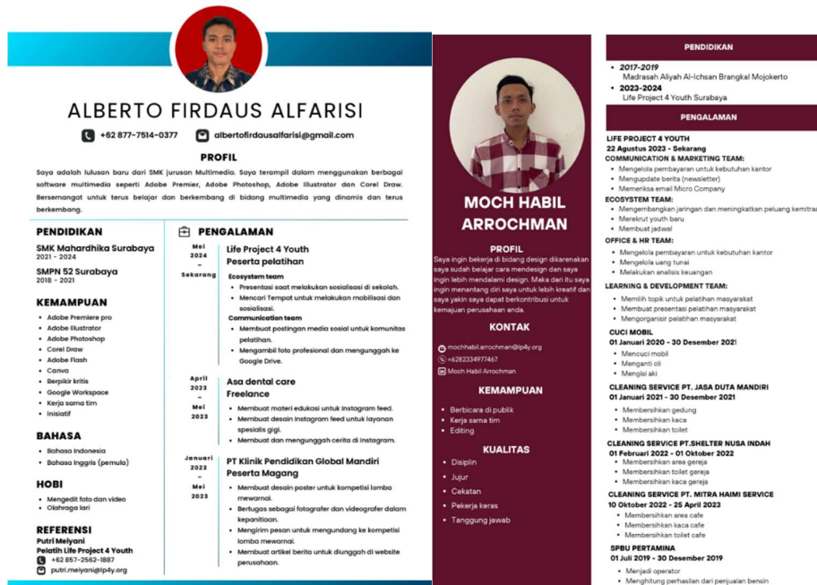
Gambar 3. Contoh CV yang Dihasilkan Peserta