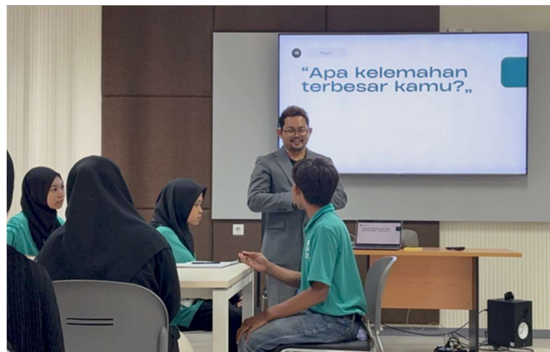
Gambar 2. Pemaparan Materi Shaping Creative Curriculum Vitae

Tahap berikutnya setelah sosialisasi adalah pelaksanaan program. Program pertama yang dilaksanakan bertema Shaping Creative Curriculum Vitae . Dalam pelatihan ini, para peserta diberikan materi terlebih dahulu tentang cara pembuatan CV yang baik dan benar. Materi disampaikan secara interaktif, dengan melibatkan peserta dalam proses tanya jawab. Peserta diminta untuk menggali sendiri apa saja kekurangan mereka selama ini dalam proses pembuatan CV selama ini dan bagaimana hal tersebut bisa diperbaiki serta ditingkatkan. Berikut adalah foto saat kegiatan pemberian materi: