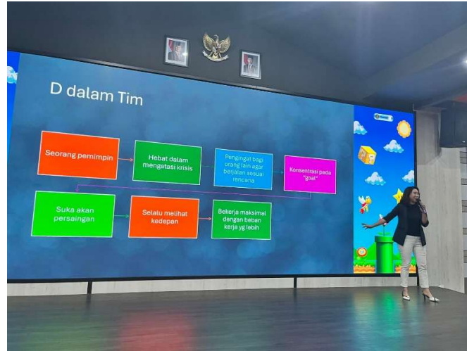
Gambar 4. Penjelasan Mengenai Psikotes

Setelah mendapatkan penjelasan mengenai psikotes, peserta dibawa ke ruangan khusus yang tersedia di Fakultas Psikologi Universitas Ciputra. Para peserta kemudian diberi kesempatan untuk mengerjakan psikotes secara langsung. Hal ini dilakukan agar peserta memperoleh pengalaman riil pengerjaan psikotes yang menjadi bekal bagi mereka jika nantinya perlu mengerjakan tes serupa saat mencari kerja. Selain itu, tes ini merupakan tes yang sebenarnya sehingga bisa diperoleh gambaran hasil psikotes mereka. Proses pelaksanaan psikotes dimulai dengan tahap registrasi dan pengarahan, di mana peserta mengisi data diri serta menerima penjelasan mengenai aturan dan jenis tes yang akan dikerjakan. Selanjutnya, peserta mengerjakan serangkaian tes tertulis, yang masing-masing memiliki batas waktu tertentu. Selama pelaksanaan, peserta mengikuti instruksi dengan tertib dan menjaga konsentrasi. Setelah seluruh rangkaian tes selesai, lembar jawaban atau hasil tes dikumpulkan untuk dinilai oleh tim psikolog. Berikut adalah dokumentasi saat peserta melaksanakan kegiatan psikotes: