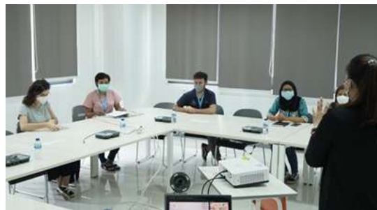
Gambar 1. Pertemuan Awal Tim UC dan LP4Y

Sebelum memulai keseluruhan kegiatan, penting untuk memahami kebutuhan dari para peserta. Maka dari itu tim dari UC melakukan pertemuan awal dengan fasilitator dari LP4Y untuk menggali kondisi pemuda binaan saat ini. Berikut adalah dokumentasi kegiatannya: