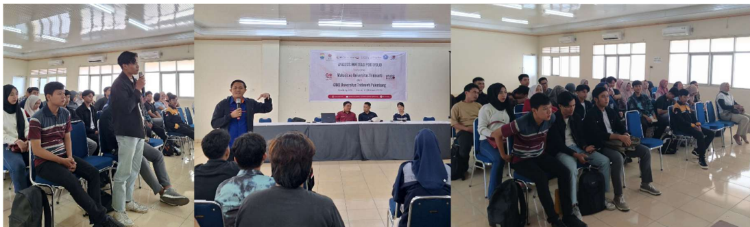
Gambar 1. Kegiatan Edukasi Literasi Keuangan

Tahap terakhir adalah pelaksanaan post-test untuk mengukur dampak pelatihan terhadap peningkatan literasi keuangan mahasiswa. Instrumen evaluasi yang digunakan sama dengan pre-test agar perubahan skor dapat dianalisis secara lebih akurat. Hasil evaluasi menunjukkan peningkatan skor signifikan pada seluruh indikator literasi keuangan, terutama pada aspek numerasi dan pemahaman bunga majemuk. Perbandingan hasil pre-test dan post-test membuktikan bahwa pelatihan berhasil meningkatkan pemahaman peserta secara menyeluruh.