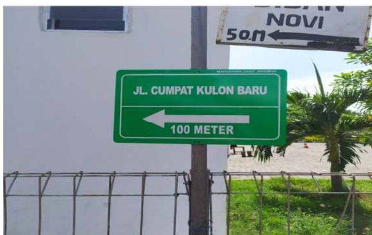
Gambar 5. Pemasangan Papan Petunjuk Jalan