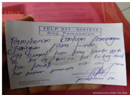
Gambar 2. Tanda Terima Surat Pengajuan Instalasi Jaringan PDAM

Kelompok 4 Pengabdian Masyarakat kembali datang di kediaman Bapak Ketua RT 04 untuk menyerahkan surat-surat berisi data-data warga dan mengambil kelengkapan berkas-berkas pengajuan untuk diserahkan pada Kantor PDAM Surya Sembada Kota Surabaya. Ternyata terdapat beberapa data yang belum dilengkapi, kemudian surat-surat beserta kelengkapannya diserahkan kembali kepada Bapak Ketua RW 02 yang kemudian pengurusan pengajuan pemangan instalasi jaringan dilakukan sendiri oleh Bapak Ketua RW 02 Kelurahan Kedung Cowek Surabaya.