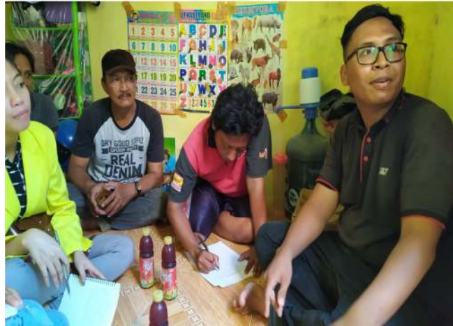
Gambar 3. Pendataan Pengajuan Instalasi Jaringan PDAM

Apabila dalam penentuan tarif penggunaan air yang ditetapkan oleh PDAM dikelompokkan dalam enam kelompok sesuai kebutuhan masyarakat, yaitu untuk keperluan rumah tangga, sosial, niaga, industri, instansi pemerintah dan tangki air maka secara umum berlaku sesuai besarnya tarif satuan ( m^3 ) yang dibayarkan oleh konsumen dalam setiap bulannya (Nurhotijah, 2017). Sesuai Peraturan Menteri Dalam Negeri No. 23, tarif air merupakan kebijakan harga jual air minum dalam setiap meter kubik ( m^3 ) atau satuan volume lainnya sesuai kebijakan yang ditentukan oleh Kepala Daerah dan PDAM yang bersangkutan (Mendagri, 2006). Jenis-jenis tarif air minum dikelompokkan dalam 4 macam kelompok diantaranya: