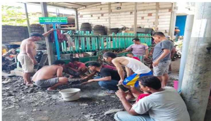
Gambar 4. Proses Pemasangan Papan Nama Jalan