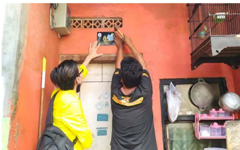
Gambar 6. Pemasangan Penomoran Rumah Warga