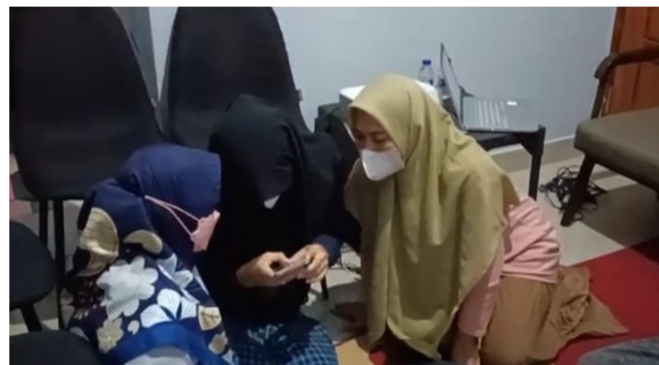
Gambar 4. Pendampingan Pembuatan Desain Promosi Produk UMKM Sawargi Makanan Khas Daerah Ciamis

Tim pengabdian melakukan pendampingan cara mendesain poster dan video presentasi kreatif sebagai media promosi produk UMKM Sawargi makanan khas daerah Ciamis. Pelaku UMKM Sawargi kemudian mendemonstrasikan desain promosi produk UMKM Sawargi makanan khas daerah Ciamis yang telah dibuat dalam bentuk poster dan video presentasi kreatif. Dokumentasi pendampingan pembuatan desain promosi produk ditampilkan pada Gambar 4.