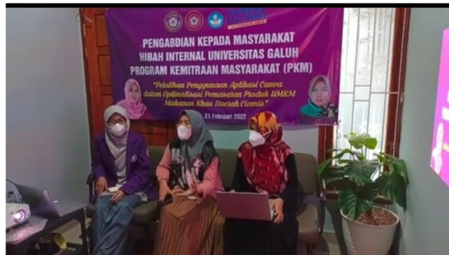
Gambar 2. Penjelasan Penggunaan Aplikasi Canva kepada Pelaku UMKM Sawargi

Tim pengabdian merupakan dosen-dosen di Program Studi Pendidikan Matematika, yaitu terdiri atas 1 orang ketua pelaksana dan 1 orang anggota pelaksana. Dibantu oleh 2 orang mahasiswa sebagai tim teknis kegiatan. Tim pengabdian mempersiapkan materi/topik bahasan tentang pengertian dan teknik penggunaan aplikasi Canva. Penjelasan aplikasi Canva ini tentang fitur-fitur dalam aplikasi Canva dan bagaimana prosedur penggunaannya. Pelaku UMKM Sawargi diberikan penjelasan dan pemahaman tentang kelebihan dan kemudahan penggunaan aplikasi Canva. Dokumentasi kegiatan pada tahap penjelasan penggunaan aplikasi Canva ditampilkan pada Gambar 2.