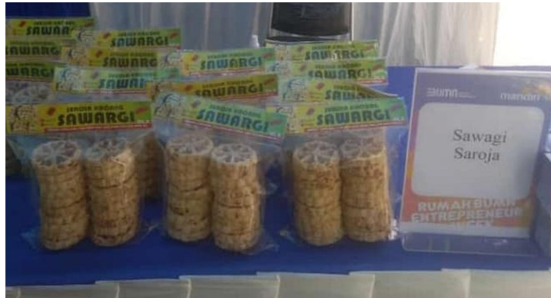
Gambar 1. Produk UMKM Sawargi

Pemasaran produk UMKM yang masih menerapkan sistem pemasaran tradisional dinilai masih kurang menjangkau pemasaran yang luas. Hal ini telah membuat pelaku UMKM tidak mengalami kemajuan yang signifikan. Keberadaan teknologi pada era revolusi industri 4.0 diharapkan dapat mengoptimalkan pemasaran produk UMKM, agar omset yang diperoleh dapat meningkat. Oleh karena itu, diperlukan penguasaan teknologi yang akan menunjang keberlanjutan UMKM. Pemanfaatan teknologi dapat memberikan dampak terhadap proses dan hasilnya (Zakiah & Fajriadi, 2020a). Hal ini dapat diupayakan dengan melakukan terobosan dan inovasi pemasaran produk, salah satunya dengan memanfaatkan aplikasi Canva.