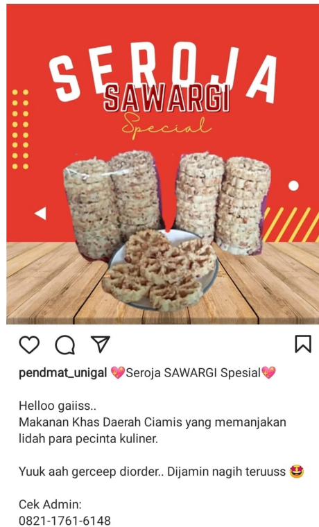
Gambar 5. Hasil Praktik Membuat Desain Promosi Produk UMKM Sawargi Makanan Khas Daerah Ciamis Disebarkan melalui Media Sosial

Diantara banyaknya media yang berkembang saat ini, tim pengabdian memilih untuk menggunakan aplikasi Canva sebagai media promosi. Media berperan penting agar produk yang dipromosikan bisa tersampaikan dengan baik dan lebih efektif. Aplikasi Canva adalah program desain online yang menyediakan bermacam peralatan seperti presentasi, resume, poster, pamflet, brosur, grafik, infografis, spanduk, penanda buku, bulletin, dan lain sebagainya yang disediakan dalam aplikasi Canva (Junaedi, 2021).