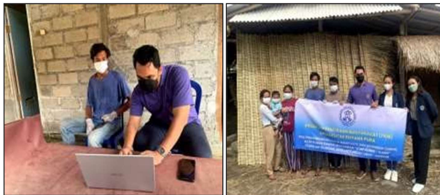
Gambar 4. Pelatihan manajemen keuangan secara komputerisasi

Dari 7 pekerja yang dilatih dalam menggunakan sistem keuangan yang profesional dalam bentuk penghitungan pemasukan dan pengeluaran secara komputerisasi, hanya beberapa (10%) dari mereka yang paham dalam mengoperasikan sistem. Setelah dilakukan pelatihan penggunaan sistem 60% pekerja mampu mengoperasikan sistem keuangan. Hal ini memang tidak mudah perlu pelatihan secara rutin yang dilakukan oleh pengabdian. Dengan penggunaan sistem dalam pengelolaan keuangan, mitra bisa dengan mudah mengetahui jumlah penjualan, pemasukan dan pengeluaran sehingga sistem penggajian juga bisa diatur selayaknya kepada pekerja.