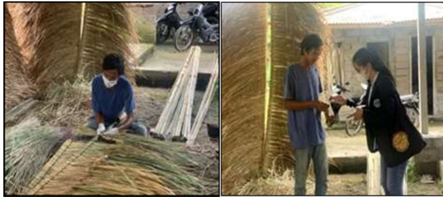
Gambar 2. Pemberian APD (Alat Pelindung Diri) kepada pekerja

Peningkatan kesehatan pekerja dilakukan dengan pemberian APD. Sebelum diberikan APD pekerja diberikan kuesioner pre-test untuk mengetahui penyakit atau gejala-gejala yang dirasakan selama bekerja. Setelah itu, diberikan APD berupa masker dan slop tangan untuk rutin digunakan. Kemudian beberapa bulan setelah pemberian APD diberikan kuesioner post-test . Hasil pengabdian diperoleh peningkatan dari 40% menjadi 90% pekerja dengan tidak merasakan gejala atau penyakit. Penyakit yang umum dirasakan oleh pekerja adalah gangguan pernafasan. Sebelumnya banyak pekerja yang mengeluhkan kesulitan bernafas karena hampir setiap hari menghirup debu yang dikeluarkan dari alang-alang. Banyak dari pekerja juga menderita luka-luka di tangan dikarenakan tajamnya alang-alang sehingga tidak jarang dari mereka mengalami luka goresan. Gejala gatal-gatal di kulit tangan dan kaki juga sering dialami pekerja karena terpapar kuman yang ada di alang-alang. Dengan pemakaian APD, kesehatan pekerja meningkat sehingga hasil produksi lebih produktif.