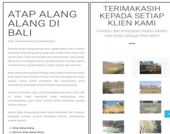
Gambar 3. Template website atap alang-alang