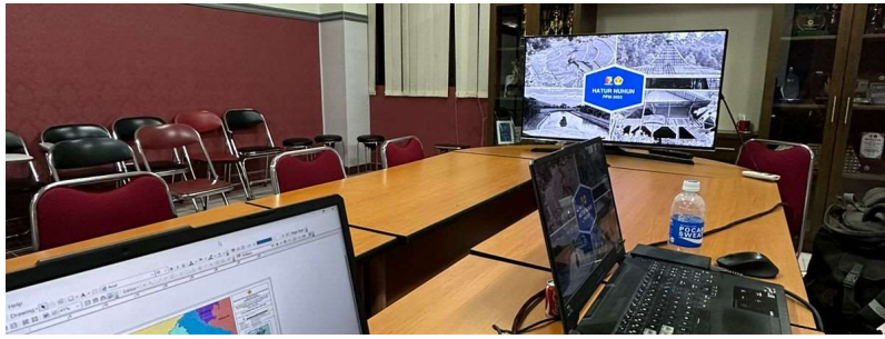
Gambar 2. Persiapan Pelaksanaan PPM dengan Tim