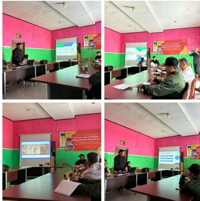
Gambar 3. Kegiatan Workshop Peningkatan Kapasitas Kelembagaan