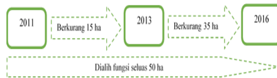
Gambar 1. Luas lahan sawah yang dialihfungsikan di Kelurahan Kersanagara dari tahun 2011-2016 menurut Penyuluh Pertanian Lapangan (PPL) Kelurahan Kersanagara

berdasarkan hasil dari sensus lapangan yang dilakukannya pada tahun 2013 dan 2016. Berikut luas lahan sawah yang dialihfungsikan di Kelurahan Kersanagara dari tahun 2011-2016.