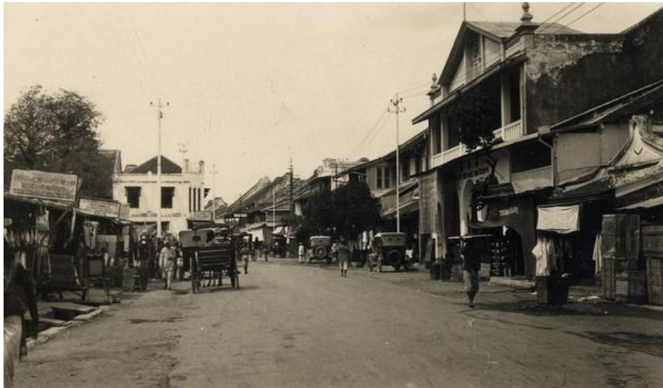
Gambar 6. Perkampungan Cina di Surakarta Tahun 1925