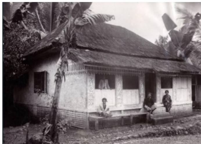
Gambar 2. Rumah Limasan di Jawa Antara Tahun 1919-1932