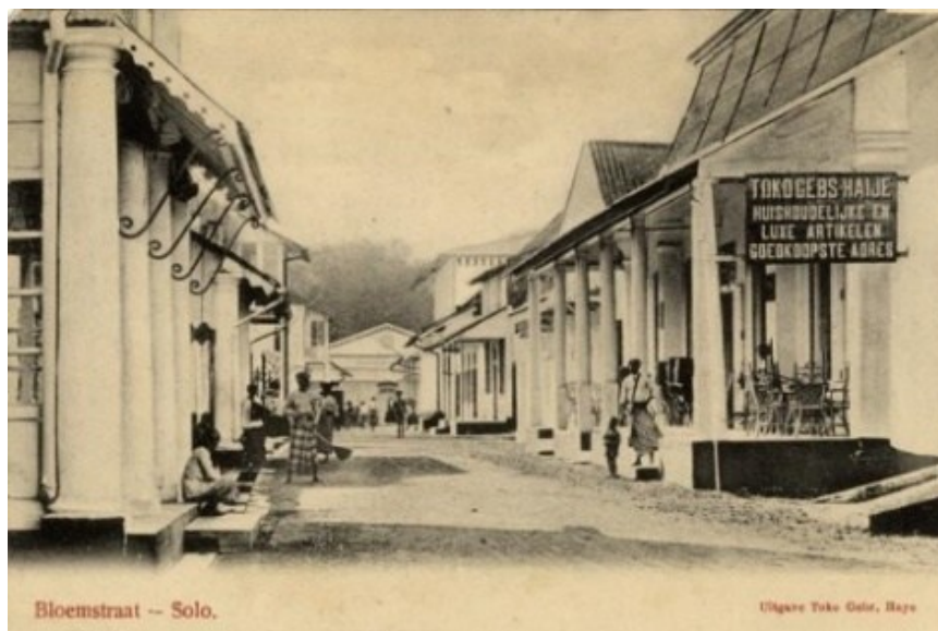
Gambar 5. Kawasan Permukiman Eropa di Surakarta Antara Tahun 1906-1930