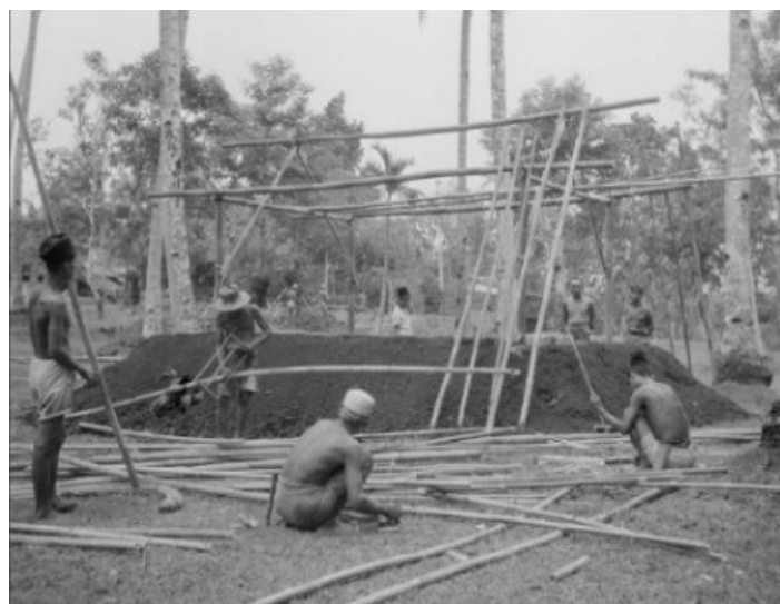
Gambar 3. Pembangunan Rumah Tipe Kampung di Jawa Tahun 1946

lingkaran-lingkaran selanjutnya. Hal ini secara sosio-kultural menjadi batasan-batasan atau aturan pendirian rumah tinggal bagi masyarakat yang hidup di lingkaran nagara , nagara agung , hingga mancanegara . Masyarakat pribumi dengan jabatan-jabatan tinggi, seperti patih dan bupati masih memungkinkan memiliki rumah tinggal bergaya tradisional Jawa dengan tipe limasan hingga joglo . Masyarakat biasa atau rakyat miskin yang cenderung hidup di bawah hierarki orang-orang dalam tembok keraton memiliki kondisi ekonomi yang lemah. Bagi mereka rumah tinggal dengan gaya tradisional Jawa tipe kampung atau panggung-pe adalah yang paling realistis. Hal ini berkaitan dengan aksesibilitas bahan material yang terjangkau, dan tidak memerlukan lahan yang luas. Bahan material yang dimaksud adalah bambu ( gelondongan ) untuk dasar konstruksi ruang dan atap, bilah bambu sebagai bahan dasar anyaman dinding, dan daun palem untuk dijadikan atap. Bagi masyarakat biasa yang memiliki ekonomi lebih baik atau pemimpin di suatu daerah memiliki kesempatan meningkatkan kualitas rumah tinggal menggunakan bahan material yang lebih kuat dan kokoh, seperti kayu balok, dan genting (Priyotomo, 1995; Sunarmi dkk., 2007).