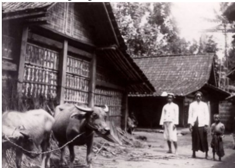
Gambar 4. Rumah Jawa Tipe Panggang-pe Antara Tahun 1910-1930

terlihat pada gundukan tanah yang dipakai untuk menahan tiang agar tidak bergeser selagi dilakukan perakitan. Rumah dengan arsitektur Jawa tipe kampung menjadi pilihan paling realistis bagi masyarakat biasa atau rakyat miskin, di samping bahan material yang didapat dari alam, lahan yang digunakan tidak banyak memakan tempat. Selain itu, masyarakat tidak akan terlalu menyayangkan rumah tinggalnya jika suatu saat terjadi kekacauan yang mengancam keamanan daerahnya, karena rumah tipe kampung dengan bahan material lokal mudah dibangun. Pembangunan rumah tinggal dengan arsitektur Jawa tipe kampung tersebut menandakan bahwa masyarakat yang hidup di luar tembok keraton cenderung lebih rentan mengalami kemiskinan.