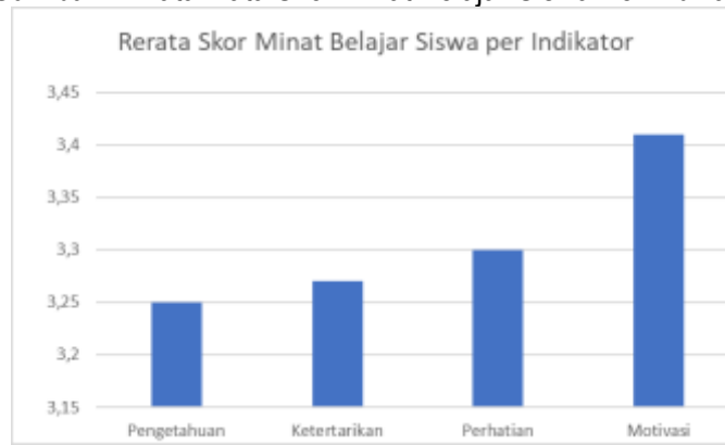
Gambar 2. Rata-Rata Skor Minat Belajar Siswa Per Indikator

Indikator pengetahuan menunjukkan capaian yang tinggi, menandakan bahwa siswa menikmati proses pembelajaran Biologi. Rasa senang ini bukan sekadar emosi sementara, tetapi menunjukkan bahwa siswa merasa siap, nyaman, dan melihat manfaat nyata dari materi yang dipelajari. Ketika siswa merasa aman secara emosional dan intelektual, mereka lebih mudah terlibat dan berani mengeksplorasi ide baru. Hal ini sejalan dengan Mawardi et al. (2021) yang menegaskan bahwa kenyamanan dalam belajar mampu meningkatkan keterlibatan kognitif siswa. Fernandez et al. (2021) juga menemukan bahwa pengalaman belajar yang menyenangkan mendorong munculnya rasa percaya diri dan kesiapan mental siswa dalam memahami materi. Dengan kata lain, rasa senang di kelas bukan sekadar “bonus” tetapi fondasi penting yang memperkuat kualitas pembelajaran.