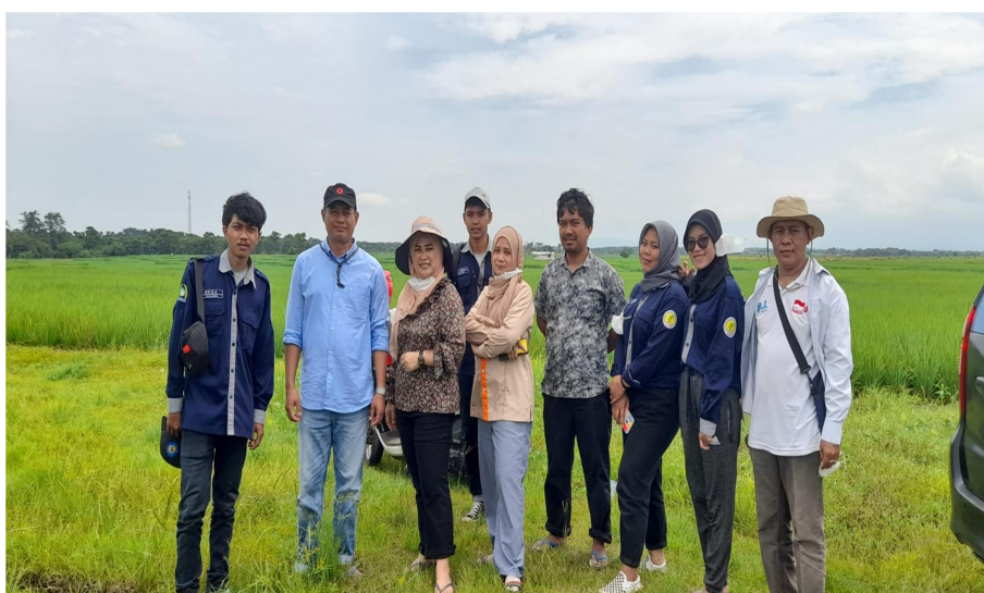
Gambar 3. Tim Dosen dan Mahasiswa Pengabdian Kepada Masyarakat

Kegiatan edukasi dalam pengelolaan keuangan keluarga tani dapat dikatakan sesuai harapan dengan dasar pertimbangan bahwa pengetahuan dan pemahaman terkait pengelolaan keuangan keluarga melalui perencanaan keuangan dengan pencatatan dan pembukuan secara sederhana telah didapatkan para peserta, namun belum dapat dikatakan berhasil dengan pencatatan dan pembukuan yang dilakukan secara kontinyu di keluarga masing-masing karena belum terlihat secara 100 persen para peserta melaksanakannya.