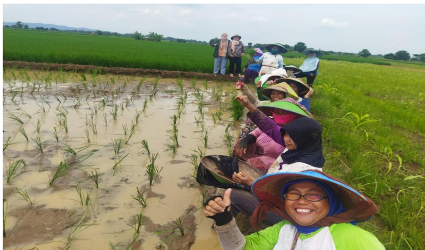
Gambar 2. Peserta Kegiatan Pengabdian Masyarakat

Kegiatan diawali dengan penyampaian materi atau edukasi dan penyuluhan oleh dosen dibantu mahasiswa secara aktif terkait pentingnya pengelolaan keuangan keluarga dalam mendukung kemandirian keluarga. Pengelolaan keuangan penting dilakukan melalui pencatatan dan pembukuan secara sederhana. Pelaksanaan edukasi dilakukan selama kurang lebih 1 jam.