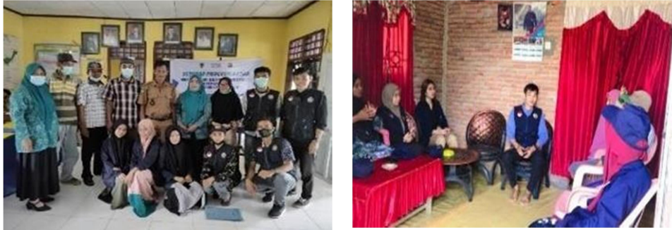
Gambar 1. Seminar program kerja serta permohonan izin kepada kepala desa dan Ketua KWT untuk melaksanakan kegiatan pelestarian taman pangan KWT

Kemudian, tim meminta izin kepada kepala desa dan ketua KWT Desa Buntu Awo untuk melaksanakan pelestarian taman pangan KWT. Alhamdulillah niat tim untuk pelestarian taman KWT ini disambung dengan sangat baik oleh bapak kepala desa dan ketua KWT Desa Buntu Awo. Setelah mendapatkan izin dari kepala desa dan ketua KWT, tim melakukan rapat persiapan membahas mengenai jadwal pembersihan lokasi serta persiapan pembibitan sayuran yang akan ditanam.