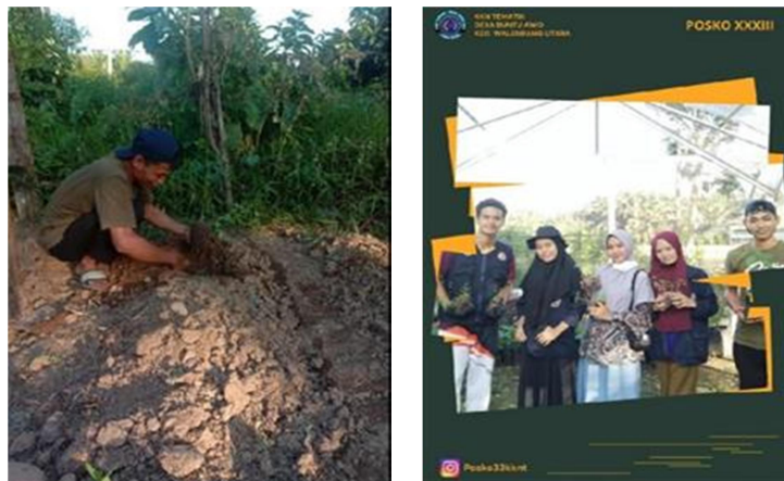
Gambar 2. Proses Penanaman

Kemudian, tim meminta izin kepada kepala desa dan ketua KWT Desa Buntu Awo untuk melaksanakan pelestarian taman pangan KWT. Alhamdulillah niat tim untuk pelestarian taman KWT ini disambung dengan sangat baik oleh bapak kepala desa dan ketua KWT Desa Buntu Awo. Setelah mendapatkan izin dari kepala desa dan ketua KWT, tim melakukan rapat persiapan membahas mengenai jadwal pembersihan lokasi serta persiapan pembibitan sayuran yang akan ditanam.