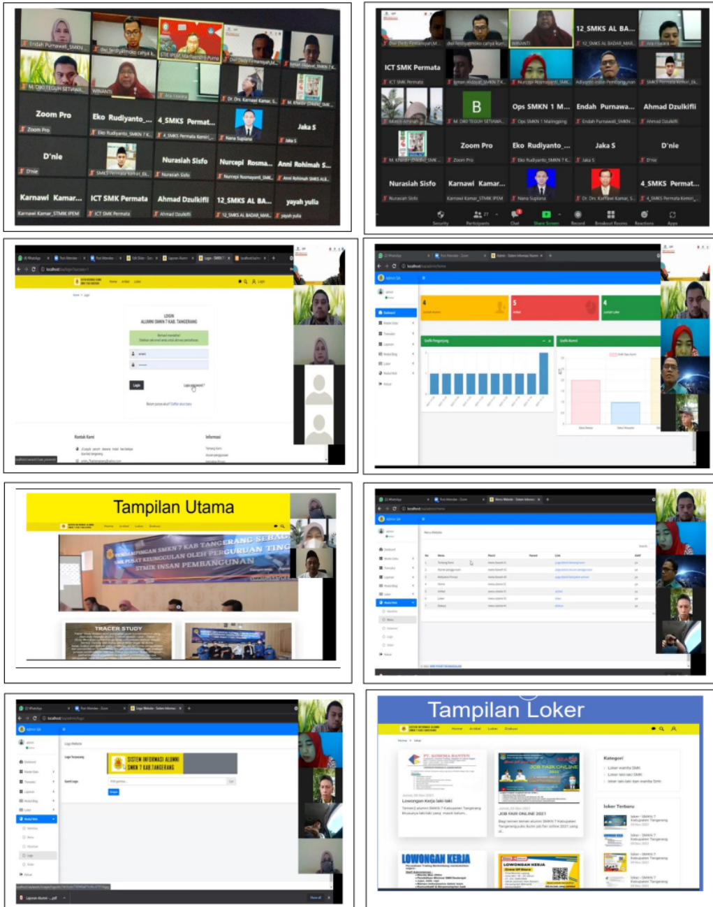
Gambar 3 Dokumen kegiatan Sosialisasi

android sehingga para-alumni yang mengisi dan update data alumni bisa dilakukan dengan mudah melalui android. Pengembangan sistem akan dilakukan dalam waktu dekat guna mendukung penggunaan platform teknologi pada 6 SMK pusat keunggulan yang di dampingi oleh kampus Universitas Insan Pembangunan Indonesia.