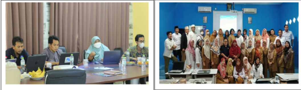
Gambar 4 Kegiatan Workshop dan kunjungan

Kegiatan sosialisasi dan workshop telah terlaksana dengan lancar, kegiatan ini diharapkan dapat memecahkan permasalahan yang dihadapi (Gosestjahjanti et al., 2023) oleh ke enam SMK dalam menangani data alumni. Ke depannya kegiatan lain akan tetap dilakukan dengan ke enam SMK di atas mengingat Universitas Insan Pembangunan telah melakukan kerjasama yang dituangkan dalam MOU bidang guru tamu, pelatihan, sosialisasi, workshop, dan kegiatan pelatihan-pelatihan lain yang berhubungan dengan ilmu manajemen, akuntansi, sistem informasi, dan teknologi informasi (Basuki et al., 2022).