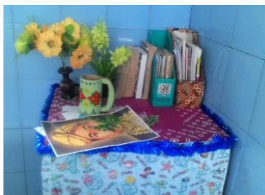
(Gambar 4 : Pojok Baca Kelas)

Dengan pemanfaatan pojok baca kelas akan memudahkan siswa untuk membaca buku dan meningkatkan kemampuan literasinya.