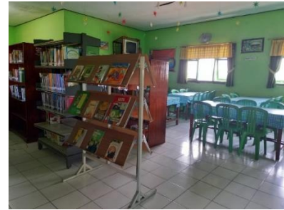
(Gambar 3 : Perpustakaan Sekolah)

Dalam mendukung penerapan Jurnal Pembiasaan Literasi membaca, perpustakaan sekolah berfungsi sebagai pendukung kegiatan proses belajar mengajar yang berperan dalam meningkatkan minat baca dan mutu pendidikan sekolah.