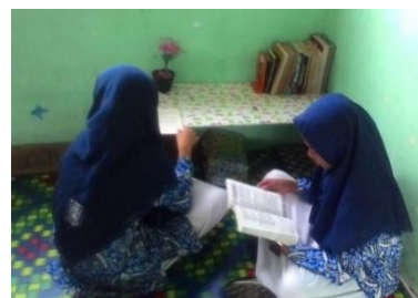
(Gambar 6 : Siswa Membaca Buku di Pojok Baca Kelas)

Dalam penataan pojok baca kelas disusun berbeda-beda, konsep penataan konsep pojok baca di setiap kelas memiliki ciri khas masing-masing sesuai dengan kreatifitas siswa dalam menghias yang didampingi oleh wali kelas masing-masing. Sebisa mungkin tempat tersebut dibuat nyaman agar suasana dalam membaca menyenangkan dan dapat sebagai hiburan dari banyaknya tugas sekolah.