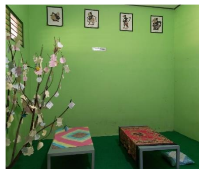
(Gambar 5 : Pojok Baca Kelas)

Pemanfaatan pojok baca adalah kegiatan untuk mendayagunakan pojok baca yang terdapat di kelas masing-masing. Setiap kelas memiliki pojok baca atau perpustakaan mini (Dafit and Ramadan, 2020). Konsep penataan pojok baca kelas yaitu, dengan fasilitas meja kecil yang di hias dan diletakkan beberapa jenis buku bacaan, sehingga siswa dapat membaca buku di waktu luang atau pada jam istirahat dengan nyaman.