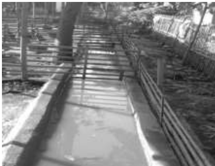
Gambar Saluran Air Minum dan Mandi Itik

Pemberian air minum menggunakan bak air minum, yang biasanya penggunaan dengan bak ketika akan menjelang sore hari. Bentuk bak air minum dan mandi itik disajikan pada Gambar 3.