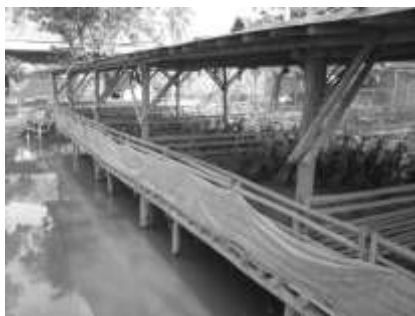
Gambar 1 Kandang Itik Kelompok Ternak Itik Putri Mandiri

Kandang pemeliharaan terbagi menjadi 10 sekat, untuk ukuran persekat 11 m x 3,5 m diisi dengan jumlah 100 ekor per kandang. Gambar kandang dapat dilihat pada Gambar 1.