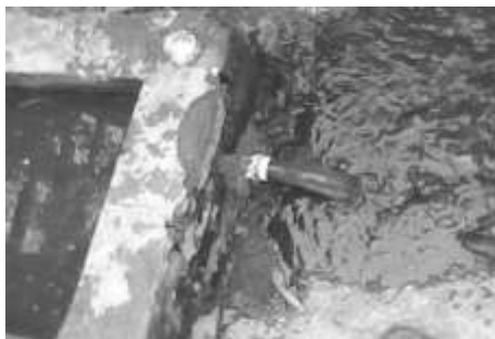
Gambar 5 Penanganan Limbah Cair

Limbah menjadi masalah yang akan timbul apabila dalam penanganan tidak serius. Apabila dilakukan pengolahan yang baik, limbah tersebut dapat dijadikan pendapatan tambahan. Kelompok Ternak Itik Putri Mandiri penanganan yang dilakukan cukup baik limbah cair ataupun limbah padat. Penanganan limbah cair yang terdapat merupakan sisa dari pencucian peralatan kandang, air berenang itik dan air minum. Pembuangan limbah cair terlihat pada Gambar 5.