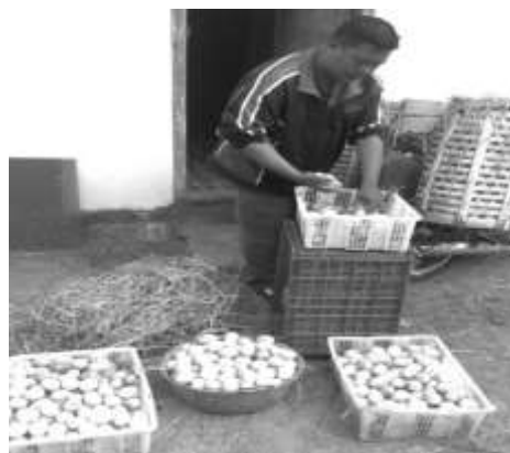
Gambar 6 Kegiatan Penjualan Telur

Itik afkir adalah itik yang sudah tidak menghasilkan telur lagi, atau produksi telurnya telah menurun (sekitar di bawah 45%) (Wakhid, 2010). Harga jual itik afkir sekitar Rp.32.000 per ekor sampai Rp.35.000 per ekor, penjualan itik afkir ini hanya dilakukan ketika ada pengafkiran. Kegiatan penjualan telur dapat dilihat pada Gambar 6.