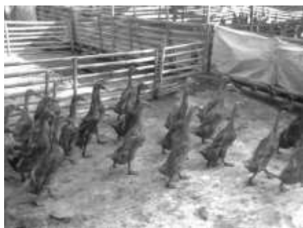
Gambar 2 Itik Karawang

Kelompok Ternak Itik Putri Mandiri memelihara itik sebanyak 980. Setiap anggota memelihara 100 ekor itik tetapi setelah berjalannya proses pemeliharaan selama 3 bulan anggota kelompok banyak yang menyerahkan ke ketua kelompok karena terhalangnya pekerjaan diladang dan keterbatasan waktu, pelimpahan pemeliharaan itik tidak ada unsur paksaan. Itik yang dipelihara oleh Kelompok Ternak Itik Putri Mandiri adalah itik petelur Karawang. Keunggulan produktivitas bertelur pada itik Karawang ini cukup tinggi mencapai 270 butir per ekor per tahun dan ukuran telur rata-rata 65 gram per butir. Jenis itik Karawang dapat dilihat pada Gambar 2.