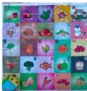
Gambar 2. Finishing Media Ludo Zimba

Pembuatan media Ludo Zimba dimulai dengan menentukan makanan sehat yang akan digunakan di dalam media Ludo Zimba, LayOut , Desain Gambar, dan Finishing .