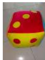
Panduan Penggunaan Media